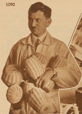
Der Kursleiter: Wer gibt mir noch ein Körbchen?