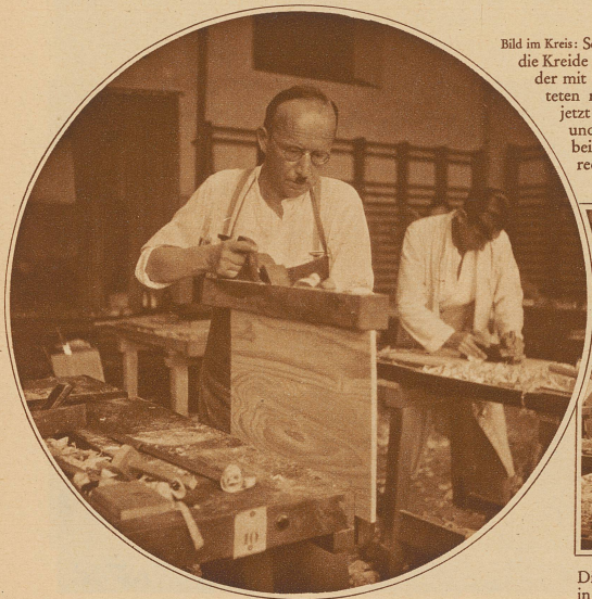
Bild im Kreis: Sonst führt er die Kreide oder die Feder mit der gefärbten roten Tinte, jetzt den Hobel und denkt dabei, ob er's auch recht mache!