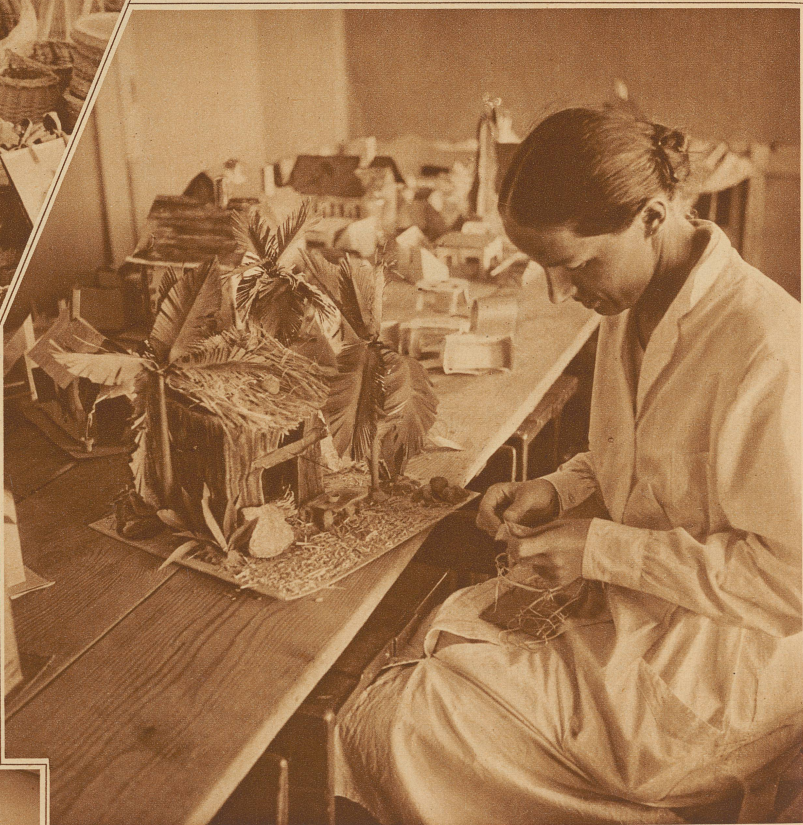
Die Kursleiterin hat als Aufgabe eine Episode aus Robinson erzählt; nun macht sich die geschickte Lehrerin und Kinderfreundin daran, Robinsons Hütte zu erstellen