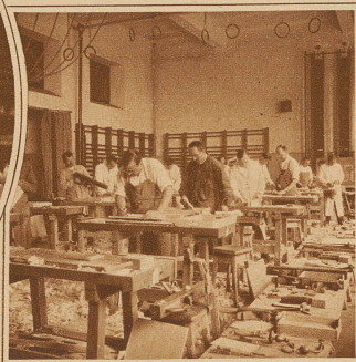
Die Schreinerwerkstatt in der Turnhalle