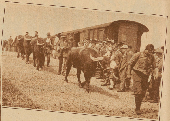
Seltene Fracht der S. B. B.: Wasserbüffel

Des Dromedars Schatten fällt jetzt nicht in den Wüstensand, sondern auf die Bundesbahnrampe