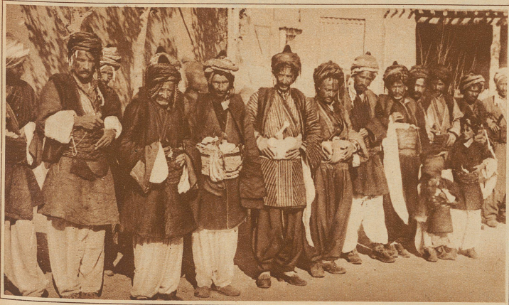
Gruppe kriegerischer Kurden aus dem Wetterwinkel im Araratgebiet