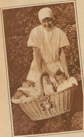
Verkauf? O nein! Es handelt sich hier keineswegs um einen Gang zum Markt, sondern nur um einen Spaziergang an die Sonne