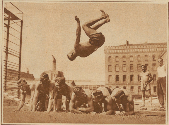
Aus der preußischen Polizeischule in Spandau. Die Schupo-Rekruten erhalten vor allem eine gründliche athletische Ausbildung, die ihnen bei ihrem spätern Dienst sehr zustatten kommt. Ein Salto über 6 Mann