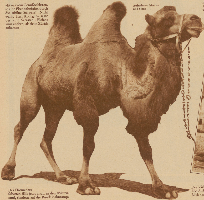
Aufnahmen Mettler und Staub

Des Dromedars Schatten fällt jetzt nicht in den Wüstensand, sondern auf die Bundesbahnrampe