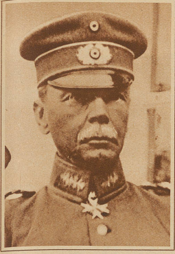
General von Seeckt, früherer Kommandant der deutschen Reichswehr, dessen neuestes Buch über Berufswehr und Landesverteidigung große Beachtung gefunden hat, kandidiert in den bevorstehenden Wahlen für den Reichstag. Von Seeckt gilt auch als einer der aussichtsreichsten Anwärter auf die dereinstige Nachfolge Hindenburgs als Reichspräsident