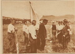
Der Kampfritze «Obmann» rechts, von einer weißen Fahne begleitet, von Rotz zu Rotz, um eventuell ererbende Mitglieder zu schlichten. Hier hat eine Abseerpartei reklamiert, weil ein Graben quer durchs Rotz geht, der das Spiel behindert; die Partei bekommt ein anderes Rotz zugewiesen