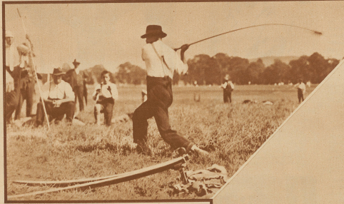
Ein ganz «Bieser» beim Schlagen

Bilder vom Eidgenössischen Hornusserfest in Bern