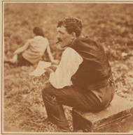
Der Kampfritzer sorgt für die genaue Beadnung der Spitzregeln