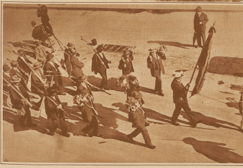
Einzug der Hornusser in die Stadt