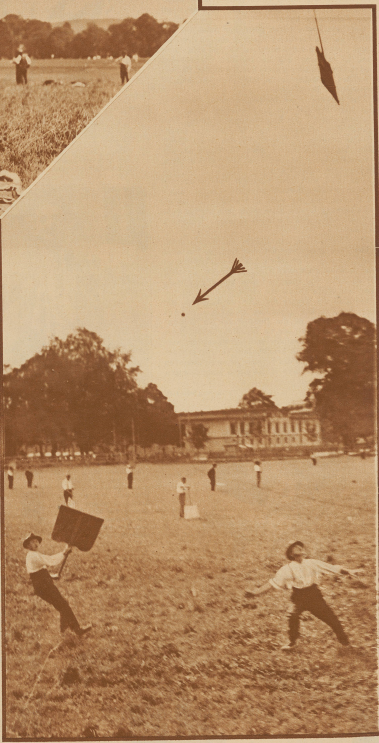
Die Abseer verbieten den fliegenden Hornuß (Heil) durch Aufwerfen der Schindeln aufzuhalten