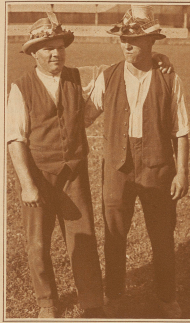
Umschmelzer: Ein Hornusser mit seinem «Traif»