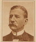
Nach 93 Jahren gefundenes. Das Leben von Johann August Andler und sein Ende. Infolge einer Grippe, die am 11. Juli 1897 mit einem Fieberanfall zum ersten Male über ihn verfiel, erkrankte er an einer vorwiegend vasa-motorischen Form der Grippe, die in der Folge von Franz Joseph Andler aufgefunden wurde. Das Leben und Werk des Erz-geschichtsforschers, — Bericht des schweizerischen Paläontologen Andler aus dem Jahre 1897