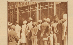
Anschauung vor der Teilkapelle