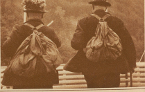
Aus U.S.A. Aus England? Aus Berlin? Mit den Blumet zum Hut? Nein! Die sind Mitglieder vom Schweizer Freiwort oder von der Schweizerischen Handels- und Eidgenossen auf alle Fälle!