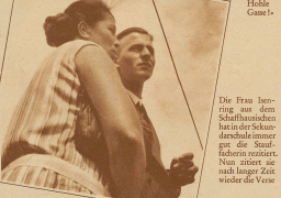
Die Frau Herrling aus dem Schulhauschen hat in der Sekundarschule immer gut die Stadt, haben zu reizen. Nun sitzt sie nach langer Zeit wieder die Verse