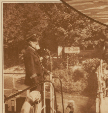
Mit dem Kapitän sind sie alle zufriedener, da ist kein Zweifel, sie vertrauen sich ihm gerne an