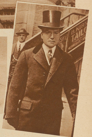
John D. Rockefeller jun., baut in New York Negerkolonien und ist auch sonst um das Wohlergehen der Schwarzen besorgt