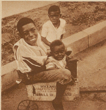
Negerkinder beim «Autofahren»

großen Städten des Nordens strömten. Sie wurden in die sogenannten Negerviertel zusammengedrückt, und hier dezimierte sie die Tuberkulose nicht nur aus klimatischen, sondern auch — und vielleicht noch mehr — aus sozialhygienischen Gründen.