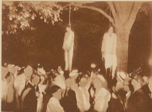
Während der Norden bemüht ist, den Negern zu helfen, wo er nur kann, führt der Süden gegen die Schwarzen einen rücksichtslosen Kampf. Erst kürzlich wieder wurde in Marion (Ohio) von der wütenden Menge das Gefängnis gestürmt, zwei junge Neger herausgeholt und im nahen Walde aufgehängt