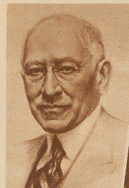
Julius Rosenwald, Besitzer des größten Warenhauses der Welt und der reichste Mann Chicagos, hat 20 Millionen Dollar für Erziehungswerke der Neger gestiftet