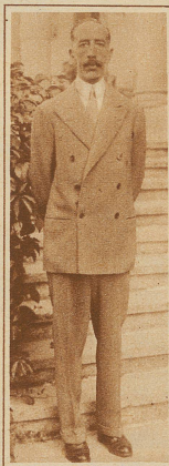
König Faissal von Irak als Kurgast im Palace Hotel Thunerhof in Thun

William Randolph Hearst, Amerikas Zeitungskönig, ist anlässlich eines kürzlichen Besuches in Paris aus Frankreich ausgewiesen worden. Als Grund wird die den Franzosen unangenehme Ver-