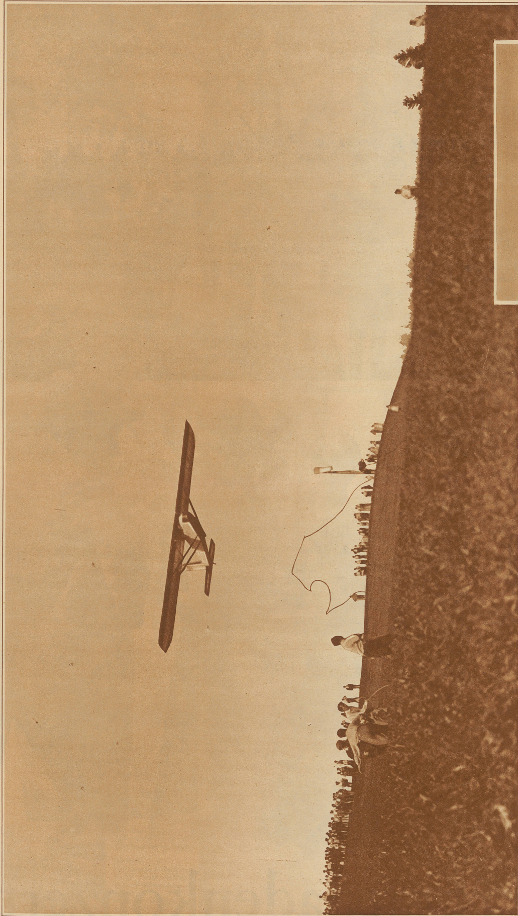
Start der «Austria». Man sieht gerade noch, wie das von der Startmannschaft gezogene Seil zu Boden fällt