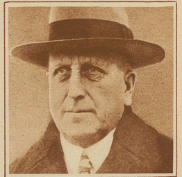
öffentlichung eines englisch-französischen Geheimvertrages angegeben. Hearst ist darauf nach der Schweiz gekommen