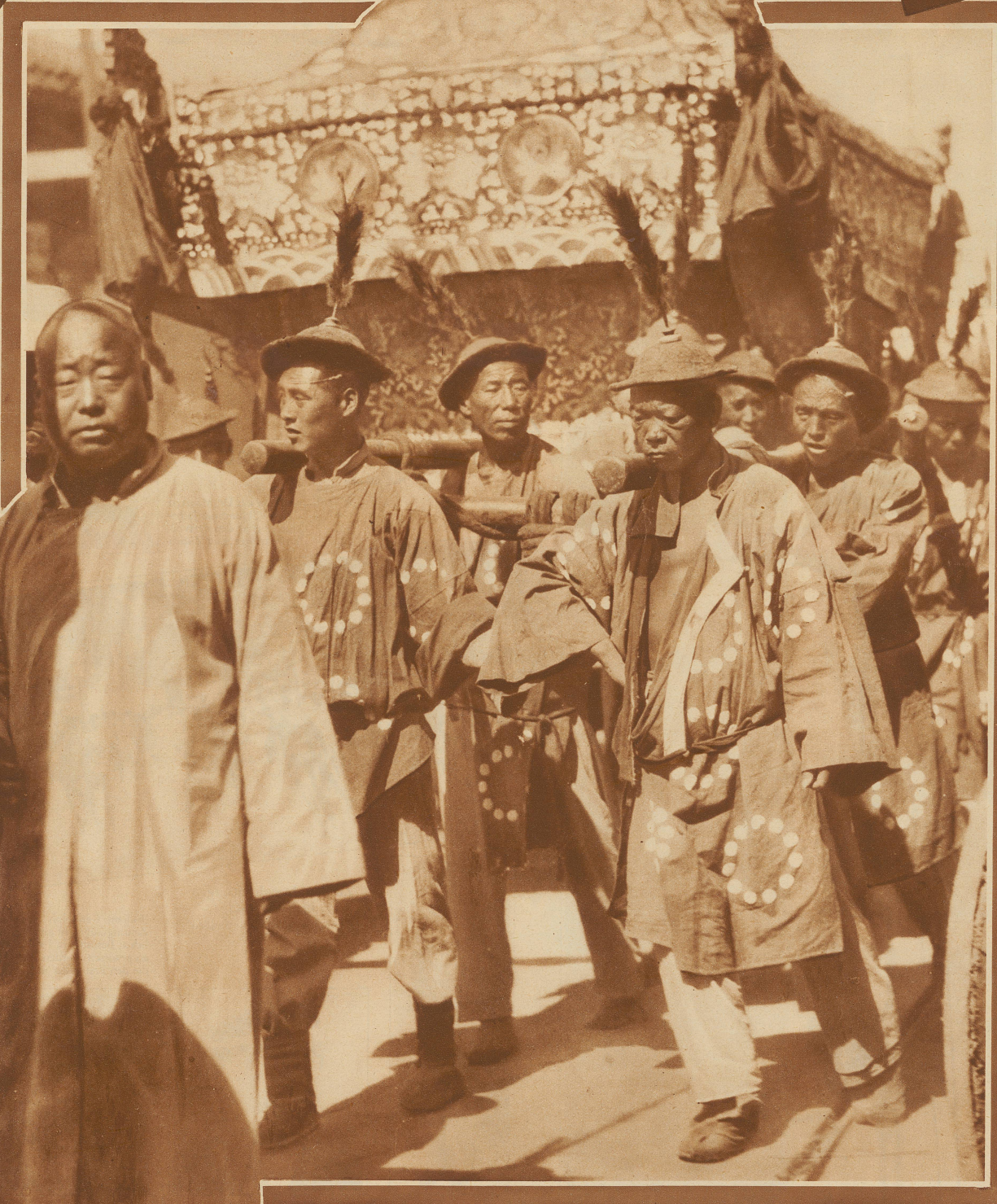
Chinesische Kulis tragen einen Sarg

Siehe Bilder und Artikel «Chinas Leiden» in dieser Nummer