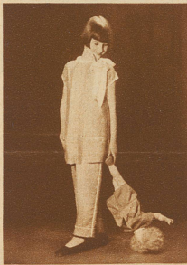
Morgenanzug aus grüner Rohseide