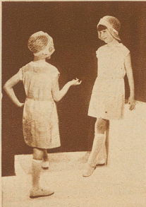
Passenkleidchen mit Hohlnähten, aus naturfarbener und marineblauer Seide

In früheren Zeiten war es Brauch, daß die Eltern ihre Kinder Abbildungen der eigenen Kleidung, nur in verkleinertem Maßstab, tragen ließen. Man wußte es nicht anders. Es mag aber auch manches Kind nicht gewußt haben, warum es sich unglücklich fühlte! Tausende haben nie erfahren dürfen, wie wonnig es ist, als Kind in zwanglosem Kleidchen herumzuspringen. Soweit ging zeitenweise der Zwang, daß kleine Mädchen sogar nachts im Schnürleib eingengt schlafen mußten, «um eine schlanke Taille» zu behalten.