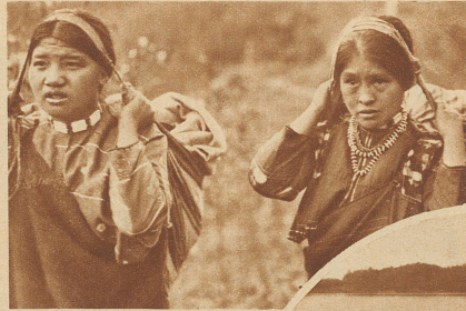
Mädchen vom Tayal-Stamm tragen das Gepäck eines Reisenden auf dem Noko-Paß (Zentral-Formosa)

ein Bauernvolk zu machen, das die Gebirgswälder rodet. Schon heute bringen die Malaien süße Kartoffeln, Bananen und Ananas auf den Markt, um von den Chinesen in der Ebene Stoffe, Farben, Salz und allerlei anderes Gut einzutauschen.