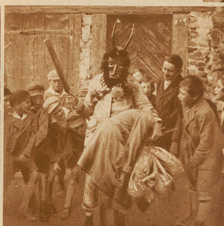
Doch der «Fulu Hund» hat schon einen Schlingel erwischt. Das setzt eine Tracht Prügel ab. Die Thuner Kinder behaupten zwar, das täte nicht weh

fen sie ihm zu. Da hüpf er mit Pritsche und Schweinsblasen ihnen nach, bis er einen der Schlingel erwischt hat. Da setzt es aber Prügel ab! Die Thuner Buben behaupten zwar, es täte nicht weh, aber wer weiß?