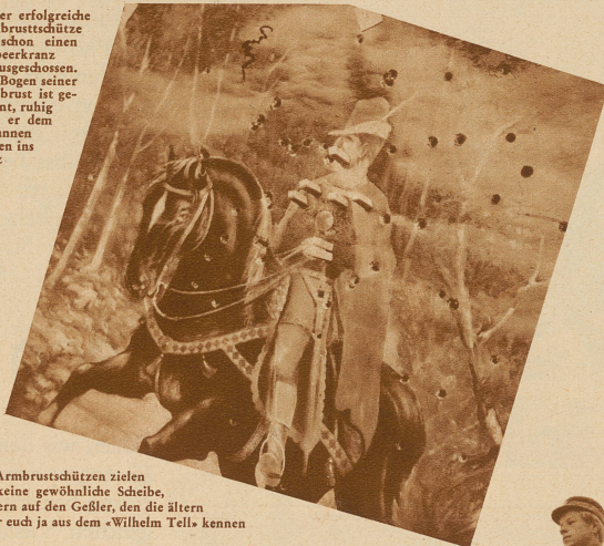
Die Armbrustschützen zielen auf keine gewöhnliche Scheibe, sondern auf den Geßler, den die ältern unter euch ja aus dem «Wilhelm Tell» kennen