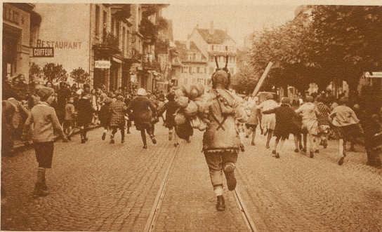
Der Ausschießer-Bajaß oder der «Fulu Hunds». Diese Maske haben die Thuner in der Schlacht bei Murten im Lager Karls des Kühnen erbeutet. Der Bajaß schlägt Mädchen und Buben in wilde Flucht. Mit Schweinsblasen und Pritsche ist er hinter ihnen her