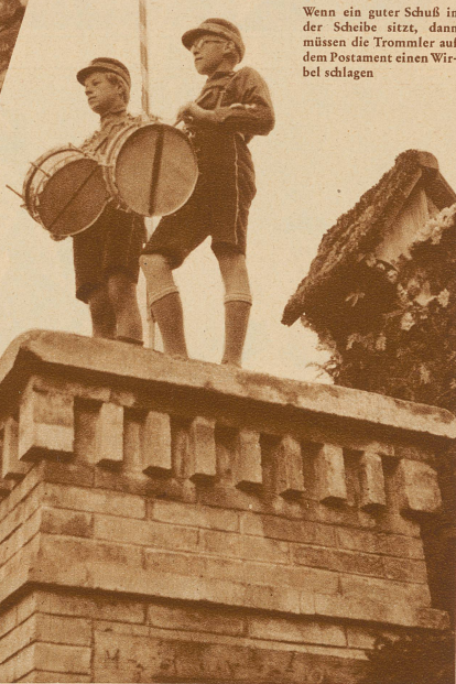
Wenn ein guter Schuß in der Scheibe sitzt, dann müssen die Trommler auf dem Postament einen Wirbel schlagen

Am Festtag stolzieren sie in mittelalterlichen Trachten herum. Die Eltern bekommen schier Angst vor ihnen, denn so kriegerisch sehen die Söhndchen das ganze Jahr nie aus. Ob sie aber die Scheibe treffen werden? Das Ziel ist jedoch keine gewöhnliche Scheibe mit vielen Kreisen, sondern ein Bild vom Geßler. Die ältern unter