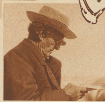
Ueber 900 Stiere im Alter von 6 Monaten bis 3 Jahren sind im Katalog verzeichnet. Der Abstammungsnachweis ist beim Kauf eines Tieres von größter Wichtigkeit