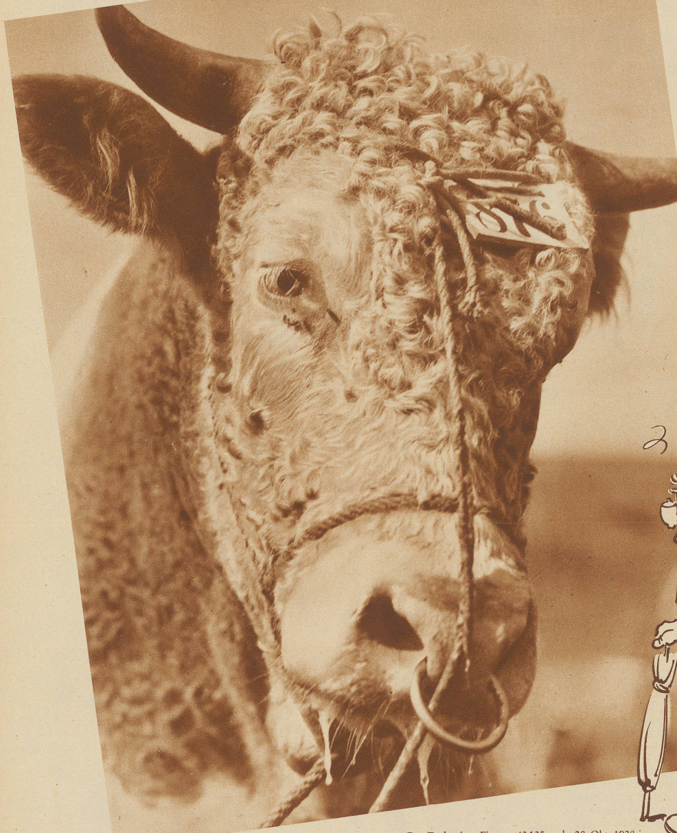
Der Zuchtstier «Figaro» 43135, geb. 28. Okt. 1928 in Fribourg, hat illustre Vorfahren. Sein Vater hieß Radio, seine Großmutter väterlicherseits Helvetia und sein Urgroßvater mütterlicherseits Fiat-Lux. Er ist den ganzen Sommer durch draußen gewesen und gar nicht hässig, «frein wien's Schöffli»

BILDER VOM ZUCHTSTIERMARKT IN BERN-OSTERMÜNDIGEN