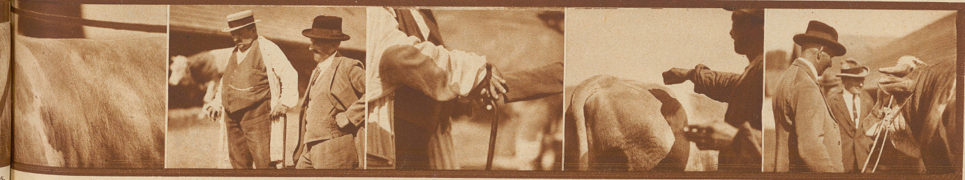
6 «Jetzt na e bitzeli lugg-lah, e paar Sekunde Zit gäh und dann bißt de Fisch a!»

Die ungarische Einkaufskommission kauft heute um 10 Uhr an eine Anzahl typische Stiere im Alter von 10-24 Monaten. Man beliebt, solche Stiere im Messelstall 4/5 vorzuführen. La commission hongroise achete 10 hrs. un certain nombre de lauréats