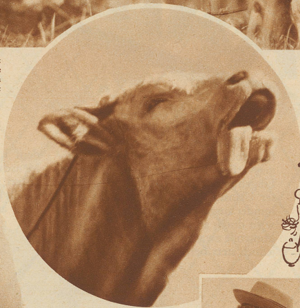
Ist's Hunger, Langeweile oder Angst vor der Zukunft, das den Stier zu solchen Aeußerungen veranlaßt?