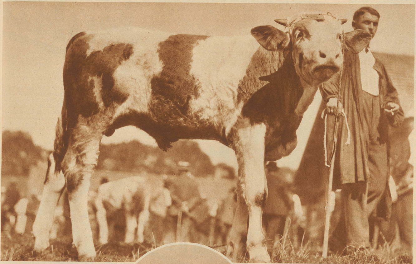
Der Simmentaler «Franz» ist erst 7 Monate alt, sieht aber getrost den kommenden Prämierungen entgegen. Gutentwickelte Stiere sind vom 12.—14. Monat an zuchtfähig. Für die Hochzucht werden nur Stiere mit hochwertiger Abstammung, tadelloser Gesundheit und einwandfreiem Exterieur ausgesucht