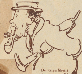
De Gigerliheiri chunnt au nid drus, er hät na kein Leitfide vo der Tierpsychologie in Hände gha