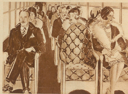
Die Fluggäste sitzen im Flugzeug auf Kabinensesseln. Die Fallschirme sind in die Sessel eingebaut

Ihr wißt, daß jetzt immer größere Flugzeuge gebaut werden. Da hätte bei einem Unglück kaum jeder Passagier Zeit, sich aus dem Fenster zu stürzen. Darum ist man auf die Idee gekommen, den Fallschirm in die Polster der Sitze zu verlegen. Wenn die Fluggäste während dem Flug in Lebensgefahr kommen und sich nur durch einen Sprung in die Tiefe retten können, dann drückt der Pilot auf einen Hebel. Da öffnen sich Armlöcher in den Polstern. Der Fahrgast streckt auf ein Kommando seine Arme hinein und plötzlich ist der Fallschirm umgeschnallt. Der Pilot schaut nach, ob alle seinem Kommando gefolgt seien. Schnell drückt er auf einen andern Hebel. Da öffnet sich der Boden unter den Fahrgästen und diese fallen durch die Versenkung in die Tiefe. Beim Absturz bleibt das Sitzgestell am Flugzeug hängen. Der Fallschirm öffnet sich zugleich und der Fahrgast ist gerettet. An seinem Fallschirm befestigt, gleitet er sicher in die Tiefe nieder. Wenn er nun über dem Wasser abstürzt, dann dient ihm das Polster seines Sitzes als Schwimmgürtel. Damit kann er sich 24 Stunden über Wasser halten.