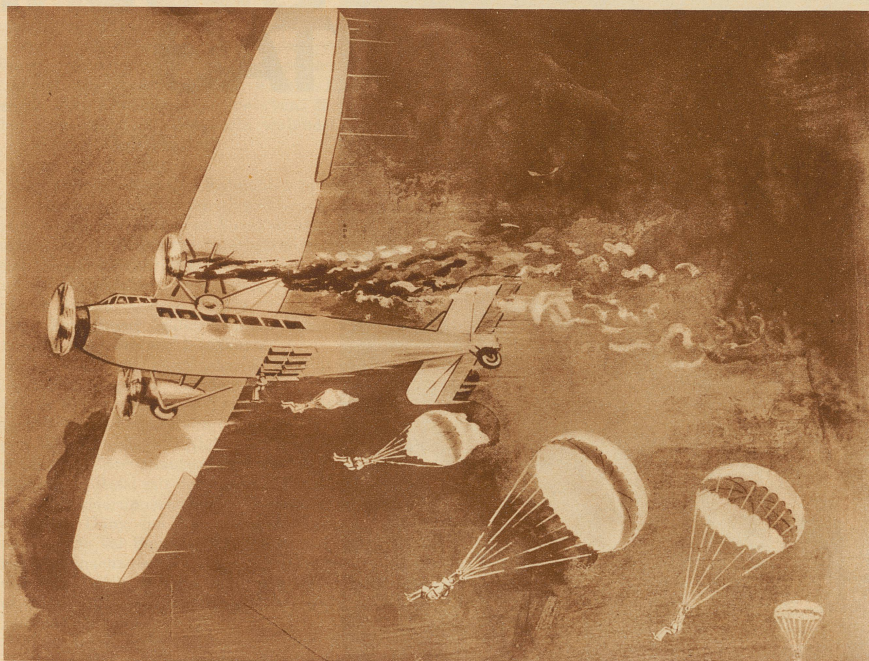
Ein Phantasiebild, das die Rettung aus einem brennenden Flugzeug zeigt. Man sieht, wie Fluggäste durch den geöffneten Boden des Flugzeuges in die Tiefe stürzten

langsam zu Boden. Der Aufschlag auf dem Boden ist nicht stärker, als wenn man von einem Tisch auf den Boden springt.