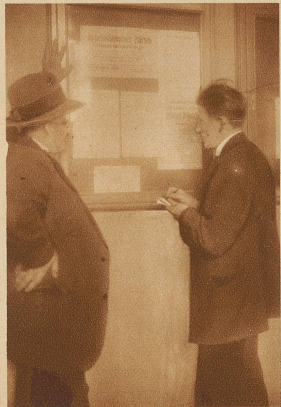
Aufnahmen aus dem städtischen Arbeitsamt Zürich

Bild rechts: Am schwarzen Brett des städtischen Arbeitsnachweises. Im 1. Quartal 1930 konnten bei 68000 Stellensuchenden und 38000 angemeldeten offenen Stellen 22000 Arbeitslose bei den schweizerischen Arbeitsämtern vermittelt werden