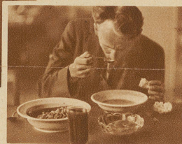
Bei einfachem, aber kräftigem Mittagessen in der Volksküche wachen die gesunkenen Lebensgeister wieder auf. Jetzt sollte man nur noch arbeiten können, um nicht auf die öffentliche Mildtätigkeit angewiesen zu sein