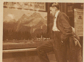
Der Arbeitslose vor einem Werbeplakat: «Verbringen Sie Ihre Ferien auf 1800 Mtr. Höhe!» — «Ja, wenn ich nur verdienen könnte!»