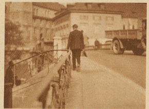
Wenn man immer auf den Beinen ist und durch die Stadt läuft, dann sehen einem die Leute den Arbeitslosen am wenigsten an