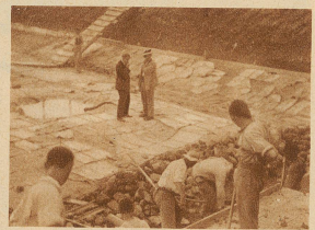
«Schon wieder einer, der Arbeit will», sagt der Polier. «Tut mir leid, Handlanger haben wir übrig genug»