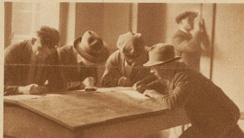
Die Gänge des Arbeitsamtes sind oft vollgepfropft. Da kommen immer wieder neue, die Stellensuche schreiben, die sich um Unterstützung bewerben, die ihre Kenntnisse und Fähigkeiten dem öffentlichen Arbeitsnachweis bekanntgeben

net, entrinnen glücklich dem Gespenst der Untätigkeit, während die Spezialisten, Arbeiter, Bürolisten und Angestellten resigniert den Kampf aufgeben müssen. Apathisch läßt der Arbeitslose nun täglich seine Karte auf dem Arbeitsamt stempeln, jeder Hoffnung bar, daß er in besseren Zeiten als ein tätiger Mensch wieder seinen Mann stellen könne.