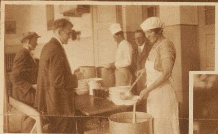
Der Arbeitslose hat vom Arbeitsamt einen Gutschein erhalten, für den er in der städtischen Volksküche ein kräftiges Mittagessen bekommt