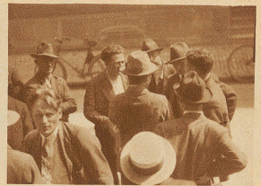
Junge Arbeitslose vor dem städtischen Arbeitsamt. Die Zeit verrinnt unbenutzt. Auf was warten sie? Sie haben Zeit zu warten. Sie müssen jeden Tag hier kommen und ihre Karten abstempeln lassen. Vielleicht ist eine Stelle am schwarzen Brett ausgeschrieben