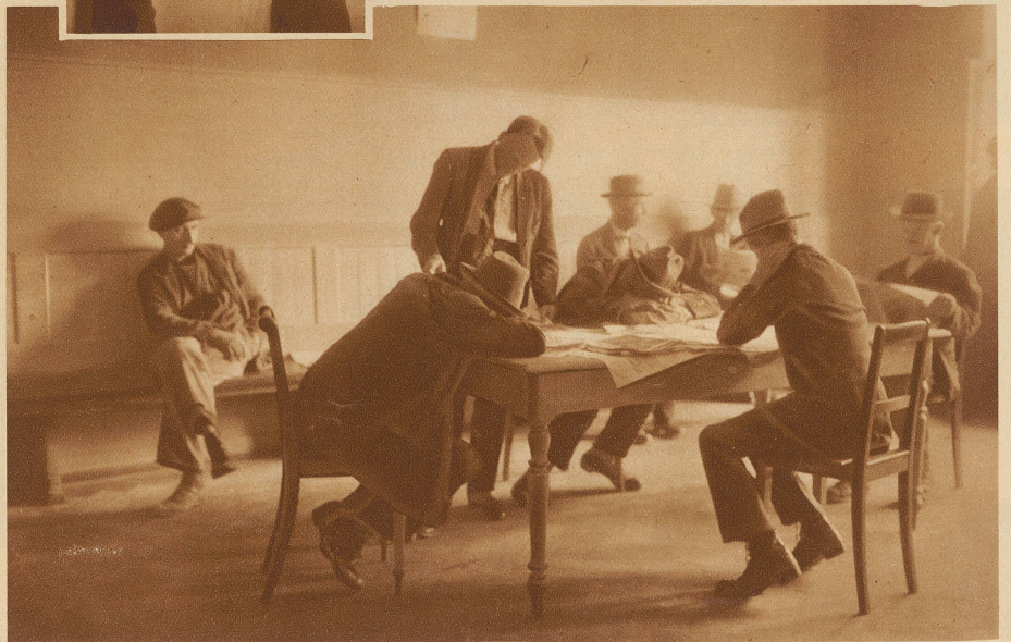
Im Winter sucht der Arbeitslose gern eine warme Stube auf. Das städtische Arbeitsamt stellt eine Wärmestube mit Gratis-Lektüre zur Verfügung. In Lesesälen, Wartesälen, in alkoholfreien Restaurants ohne Trinkzwang, überall, wo er stillschweigend geduldet wird, verbringt der Arbeitslose seine Zeit, die nicht vorübergehen will

Und überall ist das Heer der Arbeitslosen noch im Wachsen begriffen. Millionen gesunde und arbeitswillige Menschen sind dazu verdammt, resigniert die Hände in den Schoß zu legen und die öffentliche Mildtätigkeit in Anspruch zu nehmen. Welche Summe von Elend, Verzweiflung und Armut bringt dieser unnatürliche Zustand mit sich! Die Unterstützungsgelder, die Arbeitslosen ausbezahlt wurden, gehen in die Milliarden. So rechnet die deutsche Reichsanstalt für Arbeitsvermittlung und Arbeitslosenunterstützung für den Februar 1931 mit einer Arbeitslosenziffer von 4 200 000 und mit Ausgaben für das nächste Jahr in der Höhe von rund 2 1/2 Milliarden Schweizerfranken. — Jeder einzelne aus diesem Heer beiseitegeschobener Menschen wehrt sich mit Leib und Seele dagegen, nichts mehr sagen und gelten zu dürfen im Triebwerk der lebendigen Welt. Nur die Gewiegtesten, mit Vielseitigkeit bewaff-