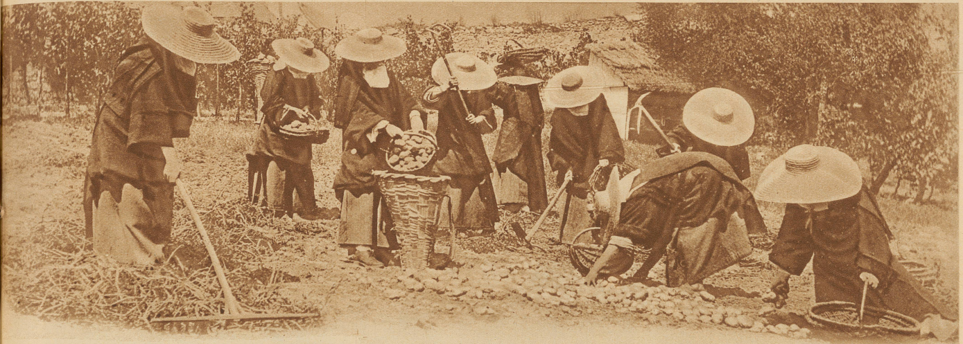
Karmeliterinnen bei der Feldarbeit. Der Photograph durfte keine Ausnahmen machen, auf denen die Gesichter zu sehen sind. Darum neigen auch hier alle die Köpfe nach vorn und verstecken sich hinter den breitrandigen Hüten