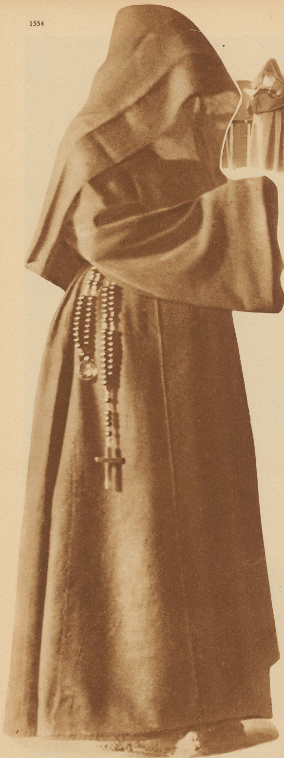
Karmeliterin beim Morgengebet

Es ist eine große Seltenheit, daß das Leben hinter der «Pforte des Schweigens» in Bildern festgehalten werden konnte, die wir hier bieten. Mönch, Nonne, Kloster — ein leiser Schauer regt sich in unserm Herzen, wenn wir nur diese Namen hören — übermenschlich schwer und grausam scheint unseren Sinnen das Leben dieser Menschen hinter den Mauern, in tiefster Einsamkeit. Und man fragt sich unwillkürlich: Was treibt diese freiwillig Verbannenen dazu, fern aller irdischen Freude, fern aller Genüsse, aller menschlichen Bequemlichkeiten zu leben? Wo liegt der Sinn eines solchen Lebens verborgen...?