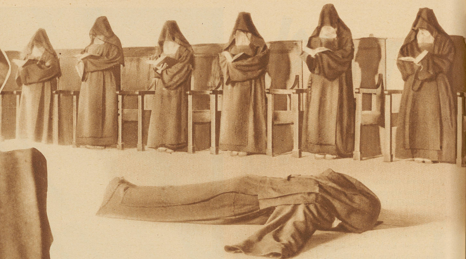
Die große Prostration. Eine Nonne hat sich zum Zeichen der Buße in Kreuzesform vor dem Altar niedergeworfen. Die Ordensschwester beten dazu

Es ist eine große Seltenheit, daß das Leben hinter der «Pforte des Schweigens» in Bildern festgehalten werden konnte, die wir hier bieten. Mönch, Nonne, Kloster — ein leiser Schauer regt sich in unserm Herzen, wenn wir nur diese Namen hören — übermenschlich schwer und grausam scheint unseren Sinnen das Leben dieser Menschen hinter den Mauern, in tiefster Einsamkeit. Und man fragt sich unwillkürlich: Was treibt diese freiwillig Verbannenen dazu, fern aller irdischen Freude, fern aller Genüsse, aller menschlichen Bequemlichkeiten zu leben? Wo liegt der Sinn eines solchen Lebens verborgen...?