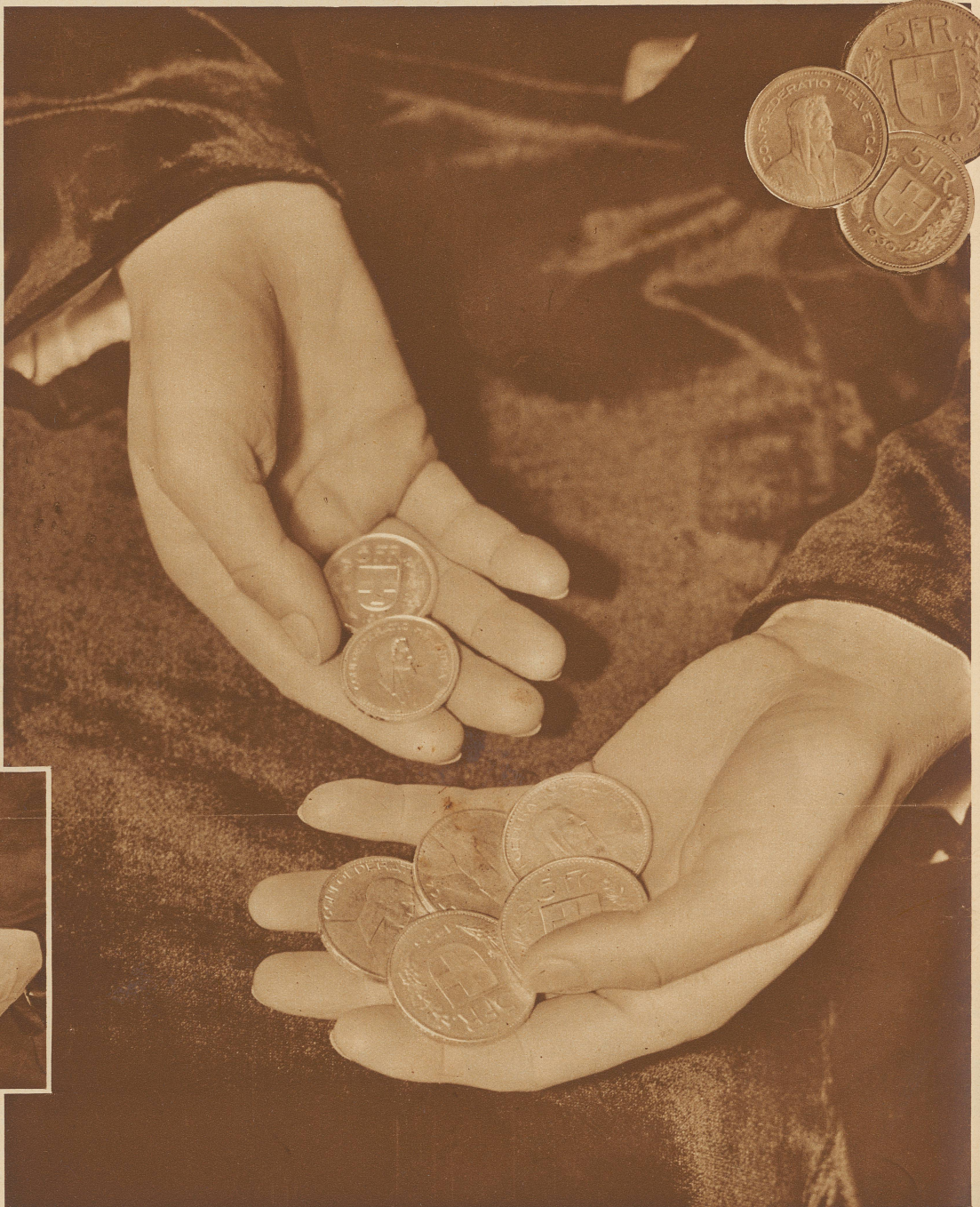
Nebeneinander rechts: Alte und neue Fünfliber. Die neuen sind Probestücke