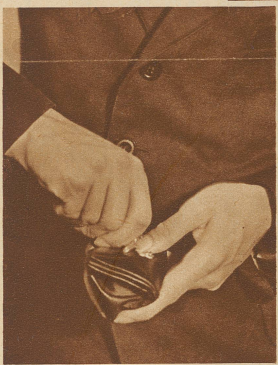
Wenn man mit einer 50 Fr.-Note bezahlt und 9 Fünfliber zurückbekommt

400 000 kg wiegen die Schweizer Fünfliber, die zu einem schönen Teil täglich in den Taschen und im Portemonnaie herumgetragen werden. Ein ganz respektables Gewicht. Aber diese Last verteilt sich ja auf so viele Taschen (leider wird mancher sagen, daß sie kaum spürbar ist. Und doch hat man, hauptsächlich seit die beliebten «Fünferntli» verschwunden sind, nie und da schimpfen gehört, unsere Fünfliber seien zu groß und zu schwer. Der Bundesrat hat diesen Klagen Gehör geschenkt und beantragt dem Parlament, den Durchmesser von 37 auf 31 Millimeter und damit das Gewicht von 25 auf 15 Gramm zu reduzieren. Zur Prägung soll nach wie vor Silber verwendet werden. Für die 2-, 1- und ½-Frankenstücke will man dem Nickel den Vorzug geben. Die bisherigen parlamentarischen Beratungen zeigten sich der Neuerung günstig, so daß mit der Ausgabe des neuen Geldes im Laufe des nächsten Jahres zu rechnen ist. — Gegenwärtig befinden sich für 80 Millionen Franken Fünfliber im Umlauf. Wegen der größeren Beliebtheit der kleineren Stücke ist vorzuzusehen, daß der Umlauf der neuen Prägung 100 Millionen erreichen wird.