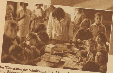
Im Wartezimmer der Schulzahnklinik. Man sucht die Kinder durch Spiele und Bilderbücher von ihren ängstlichen Vorstellungen zu befreien.

Nur fest den Mund auf. Noch mehr – so! Keine Angst, es surrt nur ein wenig. Wenn's weh tut, hör ich sofort wieder auf.