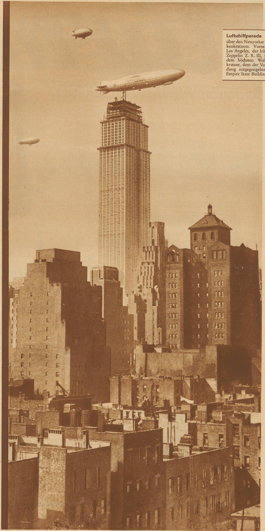
Luftschiffparade über den Neuyorker Wolkenkratzen. Vorne die Los Angeles, der frühere Zeppelin Z. R. III, über dem höchsten Wolkenkratzer, dem der Vollendung entgegenghenden Empire State Building