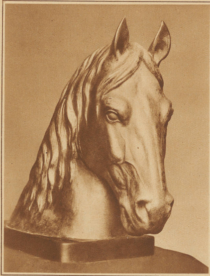
HENGST aus dem Eidg. Hengstendepot in Avenches Plastik von Bildhauer Erik Schmied

„Was?!“ — schnellte er an der Tür herum, kam an unseren Tisch zurück, nahm wütend sein Glas und zerbrach es knirschend mit den Zähnen, so daß er sich leicht die Lippen verletzte. Dann spuckte