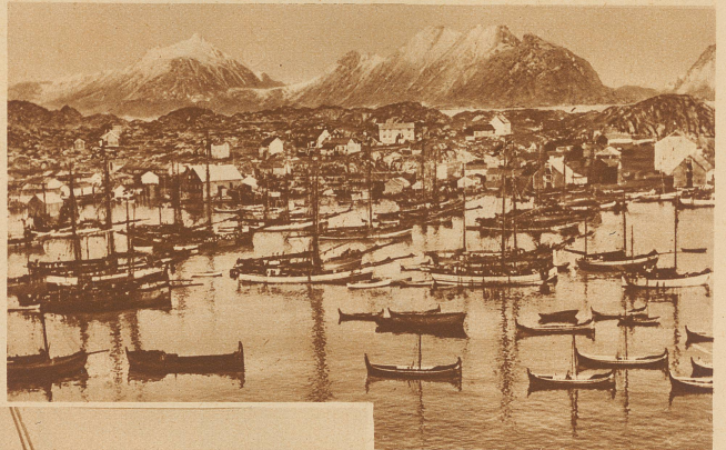
In Bolstad versammelt sich die Lofotenflotte, bestehend aus Fahrzeugen der ganzen norwegischen Küste, um in die Eismergewässer zum Fang auszuziehen