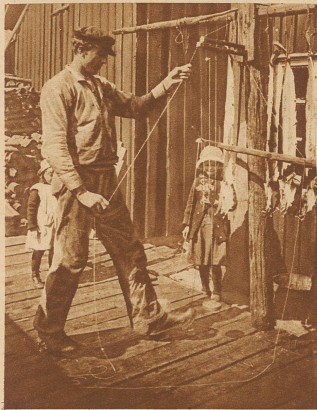
So werden die Stockfische zum Dörren in freier Luft aufgehängt

wird, geht in Spezialwaggonen lebend nach Deutschland, der Schweiz und anderen Ländern, oder wird in den Fabriken zu Konserven verarbeitet — Wie fast alle großen industriellen Unternehmungen unserer Zeit ist auch der Lofotenfischfang vertrustet und befindet sich völlig in den Händen einiger weniger Großunternehmer. Die Fischer verrichten ihre Arbeit dabei auf eigene Rechnung und Gefahr, das heißt nicht diese, sondern die Masse des Fangs wird bezahlt. Immerhin rentiert sich die Sache doch derart, daß für den einzelnen dabei die hübsche Summe von 6000 Kronen pro Saison herauskommt, ein, an unsern Verdienstmöglichkeiten gemessen, riesiger Verdienst, der jedoch auch für die restlichen Monate des Jahres ausreichen muß, in denen die Fischer beschäftigungslos sind.