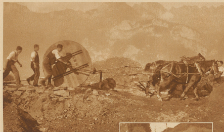
Die Leitungs-Drahtseile, über 1100 Meter lange Teilstränge, sind auf Seilwinden oder Rollen aufbewahrt. Im Transport aus der Talstufe in die Bergbahn ist ein saures Saug für Mann und Robi