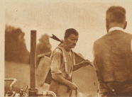
«Da würde nächsten Jahr kein Grau mehr, meint der Bauernmann aus den Flumbergern. — Es kommt eine Kermiszeit, die wird den Schaden wieder gemadern», beschwichtigt der Ingenieur