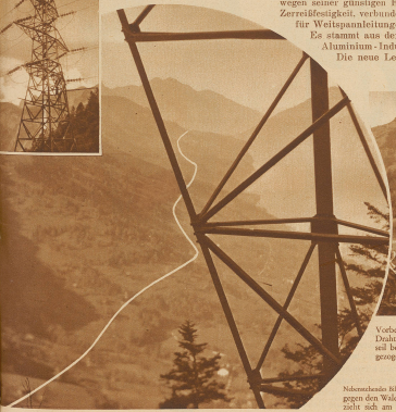
Vorbereitungen zum Schlingeln. Die Drahtseile auf die Seile wird im Wechsellager, raschell in die Höhe gezogen und von einem Mast zum andern geführt.