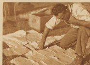
Der Chefmonteur sieht sich in dem verwetterten Leitungsblech zurechtfinden