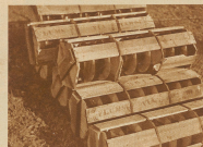
Hänge-isolatoren, die ihre Funktionen noch nicht erfüllen