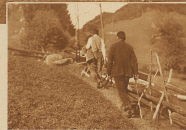
Auch Leitungs-Insolatoren auf ihrem täglichen Kontrollgang sind Kilometerreisen, aber in fleißigerem und naturbedingtem Tempo