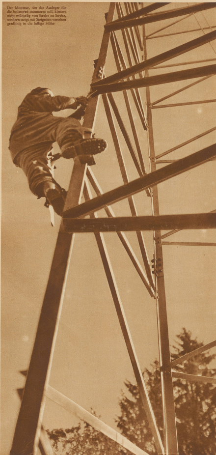
Die Meister, die die Anlage für die Isolierung montieren soll, können nicht müde werden. Sie sind in der Höhe, wo sie stehen, werden sie mit Seilen an verschiedenen Stellen versichert.