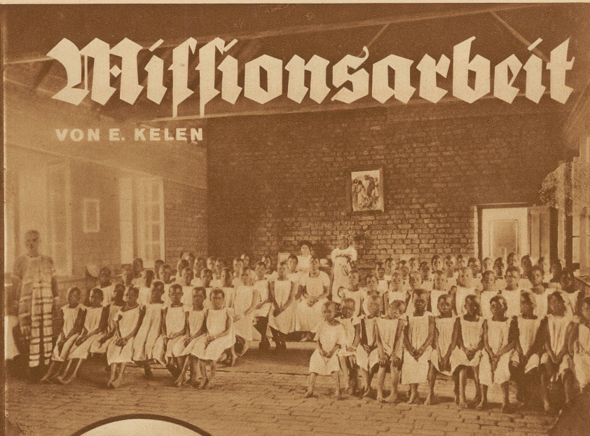
Höhere Töcherschule einer Missionsstation in Zentralafrika