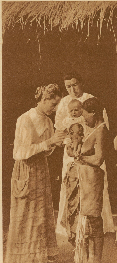
Ein kleines Negerbaby hat das Aermchen gebrochen und wird von einer Missionarin gepflegt

Schon im XIII. Jahrhundert zogen religiöse Missionare nach Karakorum, der Hauptstadt des Khans der Mongolen, und im Mittelalter streiften im Auftrage des Papstes oder der katholischen Könige die Franziskaner und Dominikaner in China, Tibet, Turkestan umher. Von ihnen haben wir die frühesten Landkarten von Abessinien. Auch die ersten wissenschaftlichen Landkarten von China stammen von den Missionaren des XVIII. Jahrhunderts. Große Dienste haben sie der Zivilisation geleistet. Sie machen astro-