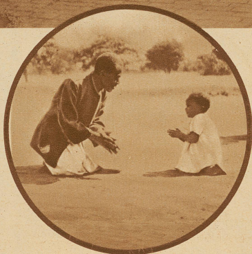
Nebenstehend im Kreis: Das erste Gebet. Ein Vater zeigt seinem Kinde, wie man die Hände falten muß, um vor Gottes Angesicht zu treten

D ft beschuldigt man die Missionare, daß sie politische Ziele verfolgen und daß sie nur die wirtschaftliche Ausbeutung der Farbigen vorbereiten. Auf alle Fälle muß aber der ungeheure Dienst anerkannt werden, den diese Menschen, die Heim und Freunde verlassen und ins Ungewisse ziehen, der Zivilisation leisten.