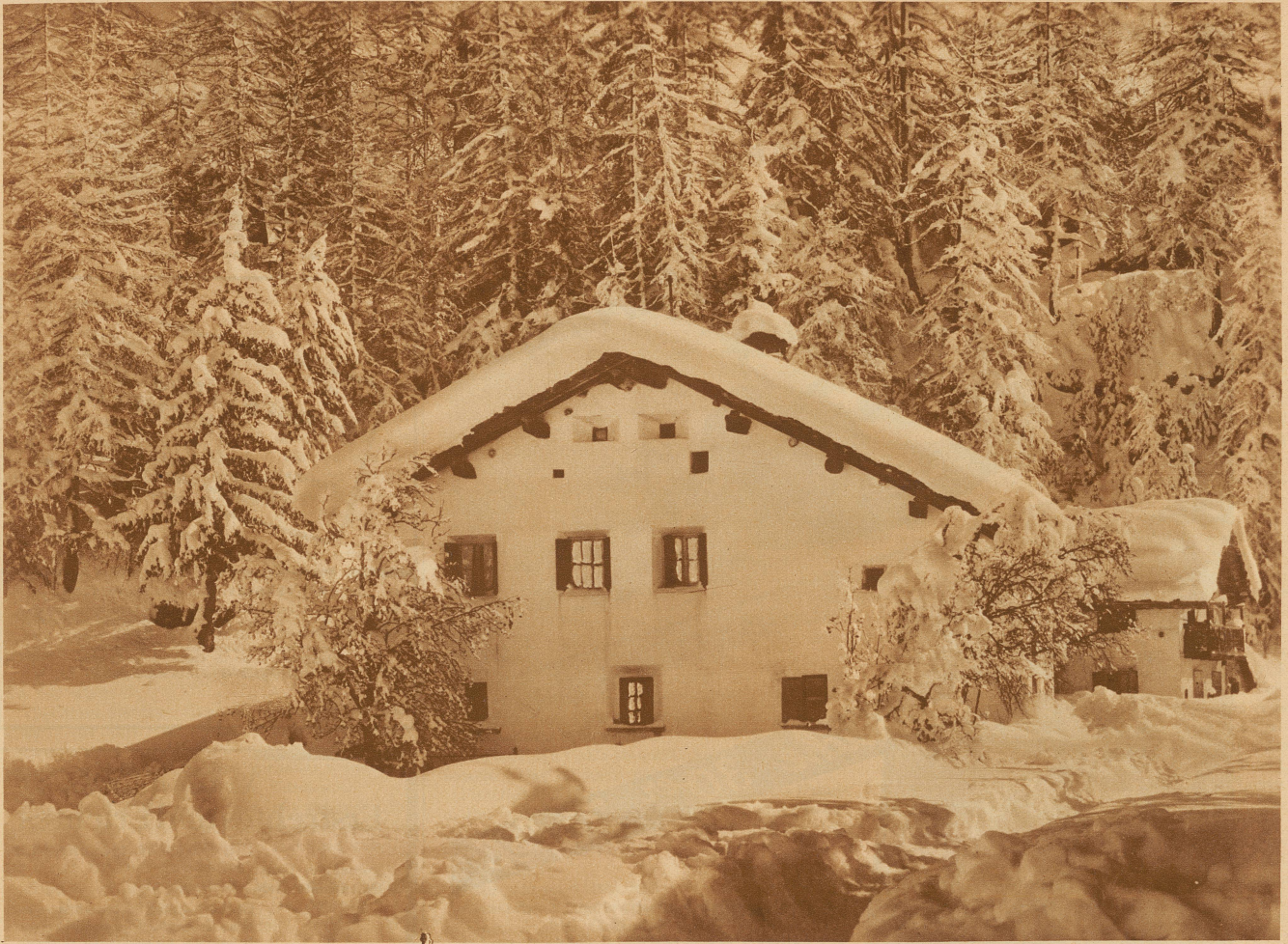
24. Dezember. Das gleiche Häuschen im Winter, sechs Monate später

Sommerfreuden, Winterzauber — Wie verschieden ist der Traum!