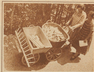
Von weit abgelegenen Pavillons werden die fertigen Artikel zur Zentrale zum Versand gebracht