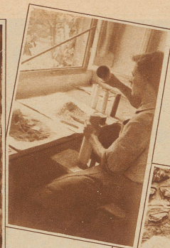
Verschiedene Sorten Pulver werden in die Hülsen gestopft