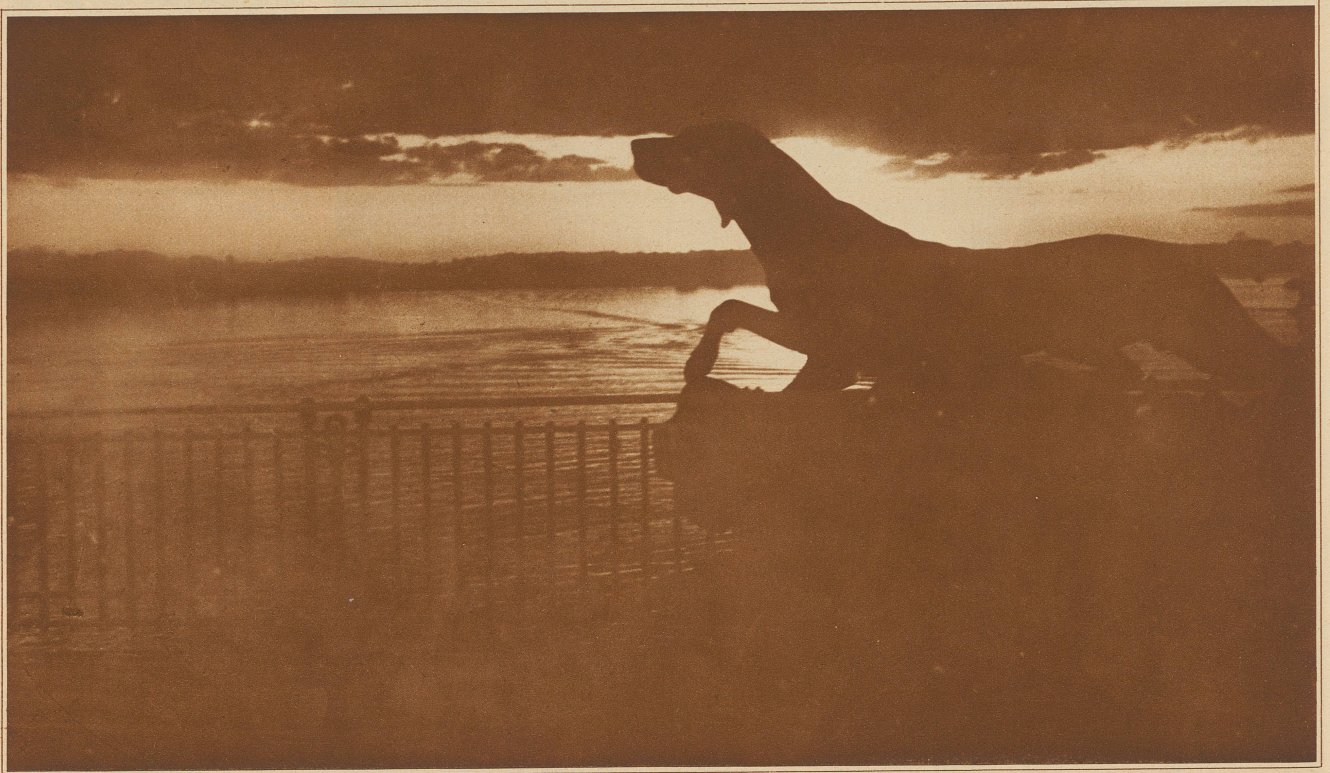
Silhouette am Abendhimmel

und wird aus einem zweiten fernerstehenden Häuschen bedient, alles wegen der Explosionsgefahr. — In den Werkstätten sind heute etwa 75 Arbeiter beschäftigt. Am Anfang des ganzen Unternehmens stehen die Versuche, die der Großvater des heutigen Besitzers, der Professor der Chemie in Bern war, mit bengalischen Beleuchtungen an den Gießbachfällen gemacht hat. — Was für Feuerdramen sind aus jenen Anfängen geworden und immer erfindet die Phantasie neue Zusammenstellungen und Ueber-raschungen. Man kann es dem Schöpfer dieser heutigen Feuerwerke nachfühlen, wie anziehend und fesselnd diese Kunst sein mag, die mit flüchtigen Farben, begleitet von Explosionen, Licht, Rauch und Bewegung ihre Gebilde an den nächtlichen Himmelt malt.