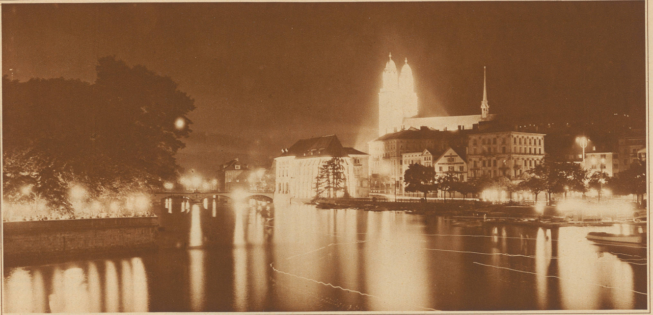
ZÜRICH. Großmünster und Wasserkirche in festlicher Beleuchtung