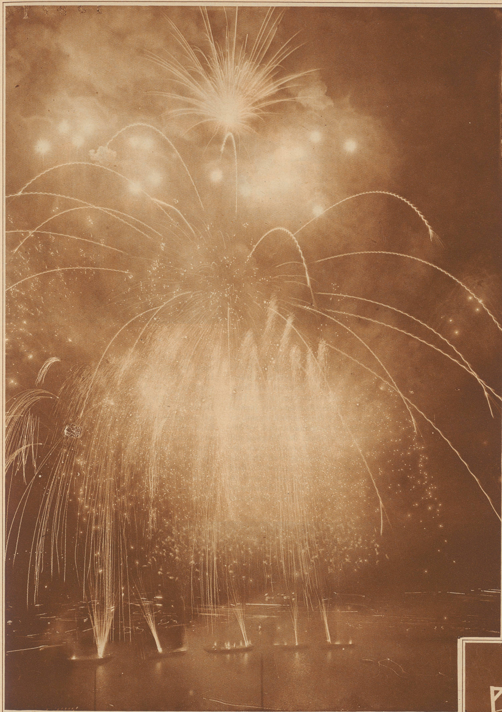
Feuerwerk: Gold- und Silberregen