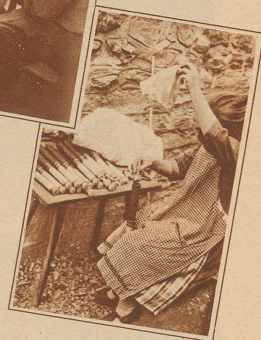
Die prächtigen, farbigen Leuchtkugeln, die am nächtlichen Himmel so langsam fallen, hängen an kleinen Fallschirmen. Das Bild zeigt, wie der Leuchtkörper und der Fallschirm in die Hülse eingesetzt werden