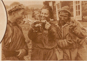
So etwas haben die Beiden in ihrem ganzen Leben noch nicht gesehen: einen Photo-Apparat. Eine junge Lehrerin aus dem Norden hat nämlich eine Wanderung durch ihr Gebirge gemacht. Sie hat bei ihnen übernachtet und essen dürfen und jetzt zeigt sie ihnen dafür ihren feinen Apparat. Der eine hat noch ein wenig Angst und schaut sich die Sache nur von ferne an, — aber dem anderen gefällt sie schon ganz gut, vielleicht wird er es bald selbst probieren

Hier ist eine ABC-Schule für die Altai-Frauen. Keine ist zu alt, um noch mitzulernen. Und alle tun es gerne und sind eifrig bei der Sache, auch die, die ein Kindchen auf dem Schoß haben, das sie nicht allein zu Hause lassen wollten. Die Kinder dieser Frauen werden es einmal besser haben, denn jetzt werden dort unten Schulen gebaut und sie werden lernen können, solange sie noch klein sind