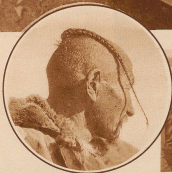
Das ist ein alter bezopfter Bauer aus dem Altai-Gebirge. Das Bild ist an einem Sonntag gemacht worden und da hat er seinen Zopf besonders schön geflochten