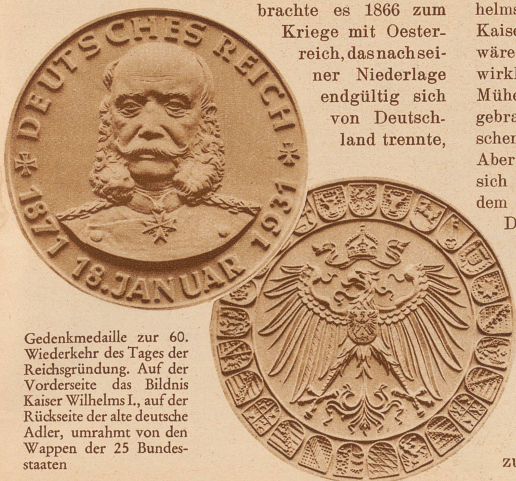
Gedenkmedaille zur 60. Wiederkehr des Tages der Reichsgründung. Auf der Vorderseite das Bildnis Kaiser Wilhelms I., auf der Rückseite der alte deutsche Adler, umrahmt von den Wappen der 25 Bundesstaaten

Aber die neue kaiserliche Majestät hatte ihren Zorn über Bismarck trotzdem noch nicht verwunden: als Wilhelm vom Podium der Fürsten herabstieg, da schritt er hoherhobenen Hauptes an seinem künftigen Reichskanzler vorbei, obwohl dieser allein auf dem freien Platze stand; den hinter ihm stehenden Generälen dagegen bot der Kaiser die Hand. — Erst nach mehreren Tagen kamen die gegenseitigen Beziehungen wieder ins alte Geleise.