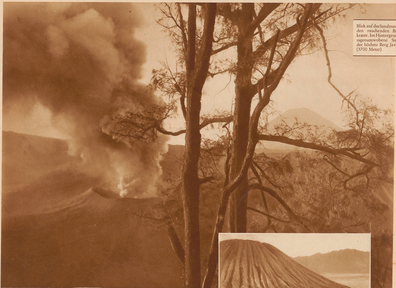
Blick auf das Sandmeer und den rauchenden Bromokrater. Im Hintergrund der sagenumwobene Smeroe, der höchste Berg Javas (3700 Meter)