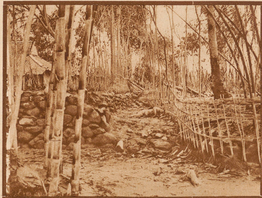
Beim kürzlichen Ausbruch des Merapi-Vulkans, der mitten in der Insel Java gelegen ist, sind über 1400 Einwohner ums Leben gekommen. Die 8 Dörfer, die durch den Vulkanausbruch zerstört wurden, bieten einen trostlosen Anblick

Die «Zürcher Illustrierte» erscheint Freitags • Schweizer Abonnementspreise: Vierteljährlich Fr. 3.30, halbjährlich Fr. 6.30, jährlich Fr. 12.-. Bei der Post 30 Cts. mehr. Postscheck-Konto für Abonnements: Zürich VIII 3790 • Auslands-Abonnementspreise: Beim Versand als Drucksache: Vierteljährlich Fr. 4.50 bzw. Fr. 5.25, halbjährlich Fr. 8.65 bzw. Fr. 10.20, jährlich Fr. 16.70 bzw. Fr. 19.80. In den Ländern des Weltpostvereins bei Bestellung am Postschalter etwas billiger Insertionspreise: Die einspaltige Millimeterzeile Fr. - .60, fürs Ausland Fr. - .75; bei Platzvorschrift Fr. - .75, fürs Ausland Fr. 1.-. Schluß der Inseraten-Aufnahme: 14 Tage vor Erscheinen. Postscheck-Konto für Inserate: Zürich VIII 15769 Redaktion: Arnold Kübler, Chef-Redaktor. Der Nachdruck von Bildern und Texten ist nur mit ausdrücklicher Genehmigung der Redaktion gestattet.