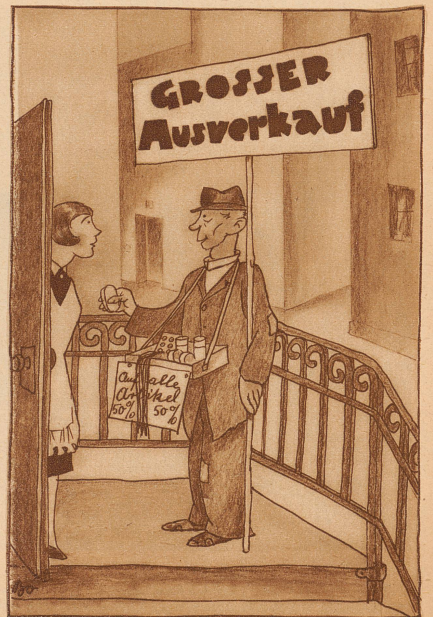
Im Zeichen der Ausverkäufe