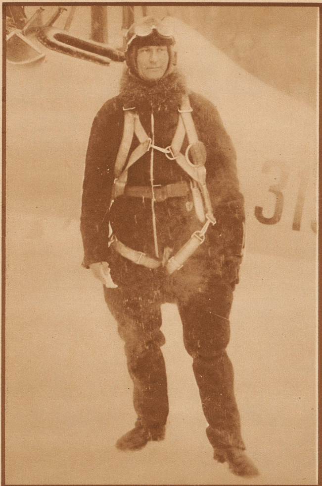
Der schwedische Fliegerhauptmann Einar Lundborg, der Retter Nobiles nach der Katastrophe der «Italia», verunglückte beim Einfliegen einer Maschine auf dem Flugplatz von Malmstät tötlich