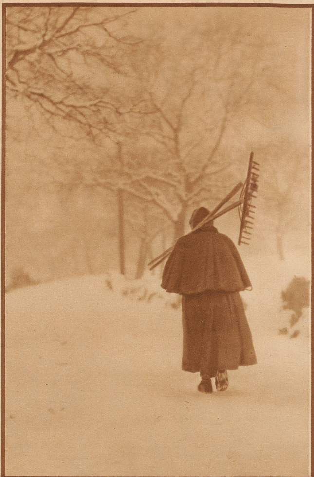
In Berlin hat man eigenartige Begriffe von der Winterarbeit der Bergbauern. Ein Berliner Photograph schreibt uns zu diesem Bild: «Aufstieg zur Weide um die verschneiten Felder freizulegen (Schweiz).» Ein Glück, daß nicht alle Photographen in Berlin «Oekonomieräte» sind!