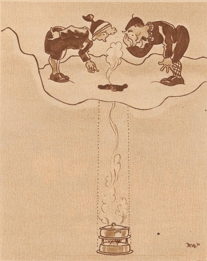
Jetzt zu Tisch, mein Fräulein ..... Himmel, wo ist denn die Suppe???