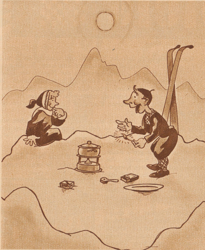
In meinem neuen Patentkocher wird die Suppe in ein paar Minuten heiß sein ...

Zeichnungen von Bert Vogler / Bavaria-Verlag, Gauting vor München