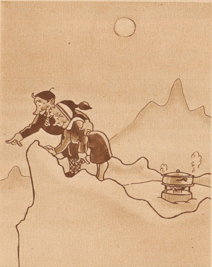
Inzwischen genießen wir die wundervolle Aussicht —