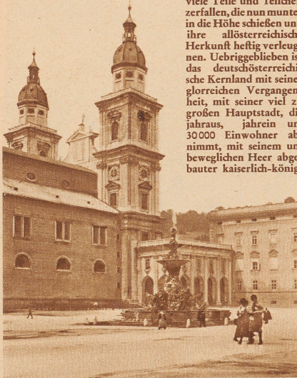
Der Dom, in dem jedes Jahr das Mozartsche Requiem und die H-Moll-Messe gespielt werden; davor der äußere Domplatz, das ehemalige erzbischöfliche Palais und ein mächtiger, dreischaliger Barockbrunnen mit kunstvollem Wasserspiel

Das alte Oesterreich, die unhaltbarste Unternehmung der Weltgeschichte, besteht nicht mehr. Vor den ungläubigen Augen derer, die es liebten, die als Kinder in der Schule sangen: «Habsburgs Thron wird ewig stehen, Oesterreich kann nicht untergehen» ist es mit Krach und einiger Staubentwicklung in viele Teile und Teilchen zerfallen, die nun munter in die Höhe schießen und ihre allösterreichische Herkunft heftig verleugnen. Uebriggeblieben ist das deutschösterreichische Kernland mit seiner glorreichen Vergangenheit, mit seiner viel zu großen Hauptstadt, die jahraus, jahrein um 30000 Einwohner abnimmt, mit seinem unbeweglichen Heer abgebauter kaiserlich-könig-