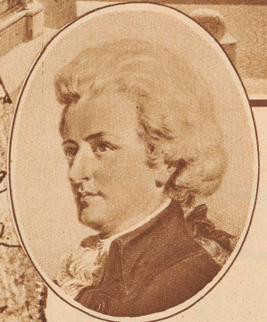
Der leicht idealisierte Mozartkopf, wie wir ihn seit unseren Kindertagen kennen. Nach einem Stahlstich von C. Jaeger

Das alte Oesterreich, die unhaltbarste Unternehmung der Weltgeschichte, besteht nicht mehr. Vor den ungläubigen Augen derer, die es liebten, die als Kinder in der Schule sangen: «Habsburgs Thron wird ewig stehen, Oesterreich kann nicht untergehen» ist es mit Krach und einiger Staubentwicklung in viele Teile und Teilchen zerfallen, die nun munter in die Höhe schießen und ihre allösterreichische Herkunft heftig verleugnen. Uebriggeblieben ist das deutschösterreichische Kernland mit seiner glorreichen Vergangenheit, mit seiner viel zu großen Hauptstadt, die jahraus, jahrein um 30000 Einwohner abnimmt, mit seinem unbeweglichen Heer abgebauter kaiserlich-könig-