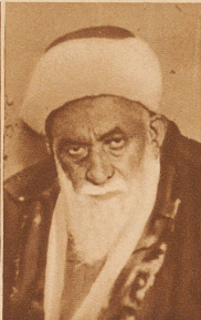
Anfangs Februar wurden in Menemen bei Konstantinopel 28 Türken, die gegen die türkische Republik eine Verschwörung angezettelt hatten, gehängt. Der 93-jährige Scheik Esat , das Haupt der Verschwörung, starb vor der Hinrichtung an einem Herzschlag im Gefängnis