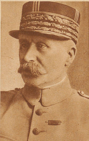
Marschall Petain war in den letzten Jahren Oberbefehlshaber der französischen Armee. Er ist jetzt von seinem Posten zurückgetreten, um der Kommission für die Verteidigung Frankreichs gegen Luftangriffe seine Dienste als Vorsitzender ungehindert widmen zu können