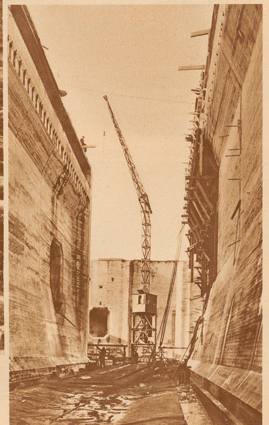
Aus hohen Betonwänden, die später dem Druck der Wassermassen standhalten können, wird die Riesenschleuse in Bremerhaven gebaut

wachsen aus unserer Erde empor, türmen sich von Jahr zu Jahr höher und höher. Auf ihrem Grunde rasen Autos, wie in den Straßenschluchten New Yorks; — strömt Wasser, wie in Kanälen und Schleusen. Kann es einem nicht Angst werden bei diesem Anblick? Ist es nicht die Vermessenheit der Erbauer des Turmes zu Babel, die in uns neu auflebt? Aber jene wollten nichts anderes, als herausfordernd kühn sein, — wir bezwecken letzten Endes nur das einfachste Glück der Erdenkinder: Brot und Freiheit von den Elementen.