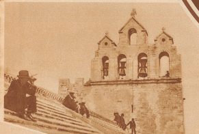
Die Burgkirche von St. Marias-de-la-Mer