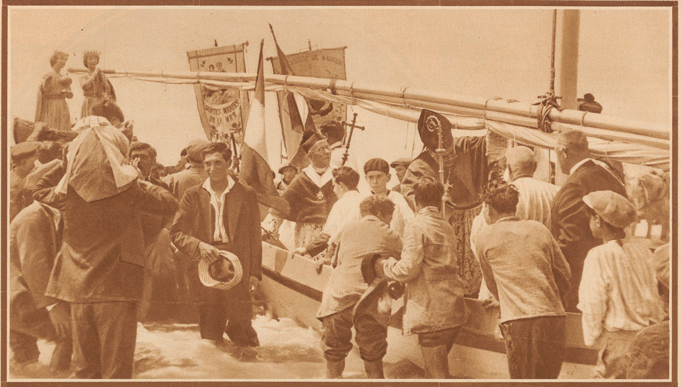
Am Strand. Im Boot der Erzbischof von Aix. Die Träger der Gnadenbilder stehen weiter draußen bis an den Gürtel im Wasser

berühmten wilden Stiere der Camargue. Die Exaktheit ihrer Reiterkunststückchen, ihre Gewandtheit bei den Turnierspielen und Stierkämpfen reißen die Menschen in einen Taumel der Begeisterung, derart, daß sie ihre Cowboys — prächtige, baumlange Kerle — auf eine ihrem südlichen Temperament entsprechende Weise feiern, die man bei uns in der gemäßigten Zone nicht kennt. Zum Schluß gibt es noch eine allerdings recht unblutige Corrida zu sehen. Der Stier wird dabei nicht getötet, sondern nur gereizt. Das be-