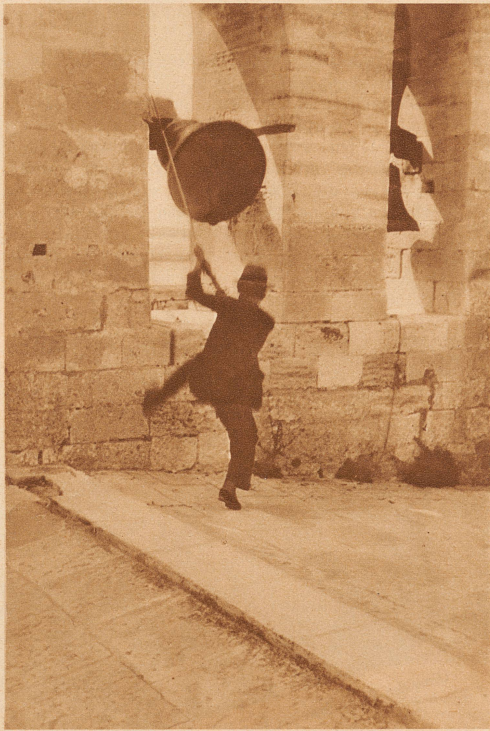
Die Glocken der Burgkirche

berühmten wilden Stiere der Camargue. Die Exaktheit ihrer Reiterkunststückchen, ihre Gewandtheit bei den Turnierspielen und Stierkämpfen reißen die Menschen in einen Taumel der Begeisterung, derart, daß sie ihre Cowboys — prächtige, baumlange Kerle — auf eine ihrem südlichen Temperament entsprechende Weise feiern, die man bei uns in der gemäßigten Zone nicht kennt. Zum Schluß gibt es noch eine allerdings recht unblutige Corrida zu sehen. Der Stier wird dabei nicht getötet, sondern nur gereizt. Das be-