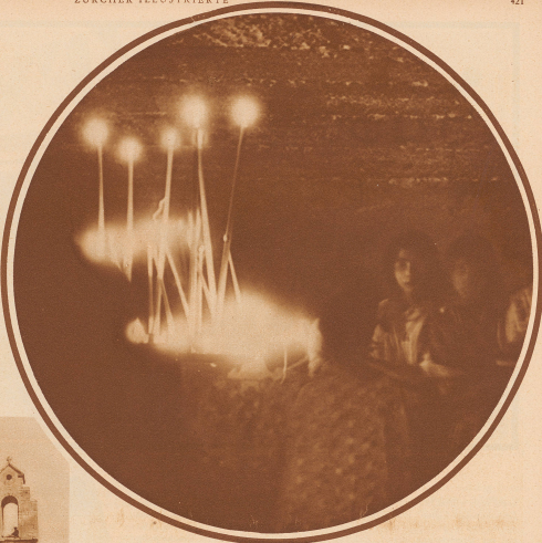
Unten in der Krypta der Kirche leuchten die Zigeuner den Sarkophag der schwarzen Sarah. Das flackernde Kerzenlicht, die dunklen Gesichter, die Gebete, all das irdische Leben zündet auch den heiligen Angekommenen in den Barm und zwingt ihn zur inneren Teilnahme

Die Menschen sinken in die Knie; nicht enden will das Rufen und Schreien, wenn die Särge des Hochaltars herköhen. Alles drängt nun wild dorthin, um eine Blume zu erhaschen und die Lippen an den heiligen wunderkräftigen Schrein zu pressen; und während dies im Kirchenschiff die Bürger Rosenkränze weben, drängen sich unten in der Krypta die Zigeuner um den Sarkophag der schwarzen Sarah, die ihnen Glück bringen soll. Hier werden Dolche gewetzt und Armreifen, ein Schlipps, eine Mütze, ein Goldbeutel, Ketten und Pferdegeschirre. Auch feiern hier die jungen Paare einzeln Stämme ihre