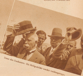
Unter dem Zodiakum: Die Heiligenbilder werden vorbeigetragen