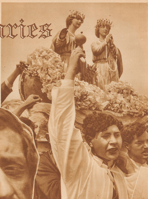
Die Gnadenbilder werden in großer Prozession durch die Straßen des Seebadens zum Meer getragen. Hoch auf den Schultern der braunen Provencalen schweben die Marien von Büumen umgeben unter dem selbsten Himmel über den Köpfen der Menge dahin.

TEXT UND PHOTOS VON WELTRUNDSCHAU- GEORG GIDAL