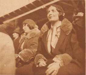
Man bemerkte in der Zuschauermenge manche schöne italienische Frau, die dem Spiel mit besonderer Hingabe und Anteilnahme folgte

Die Italiener glänzen durch intelligentes und diszipliniertes Zusammenspiel. Pasche, der Schweizer Torwart, ist aber auf der Hut. Wir sehen ihn hier bei einer seiner ausgezeichneten Abwehrtaten