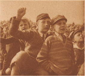
Die Berner Buben waren auch tüchtig bei der Sache. Sie schimpften, wenn etwas fehlging und schrien, wenn's geriet. «D'Schwiz isch guet», meinten sie