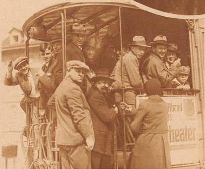
Bern hatte eine freundeigenössische Invasion zu verzeichnen. Ueber 20000 Zuschauer reisten nach dem Stadion Wankdorf. Die Berner Verkehrsmittel waren voll beschäftigt

Rechts im Kreis: Eine Viertelstunde vor Schluß das erste Tor! 1:0 für die Schweiz. Bravo! Hurrah!