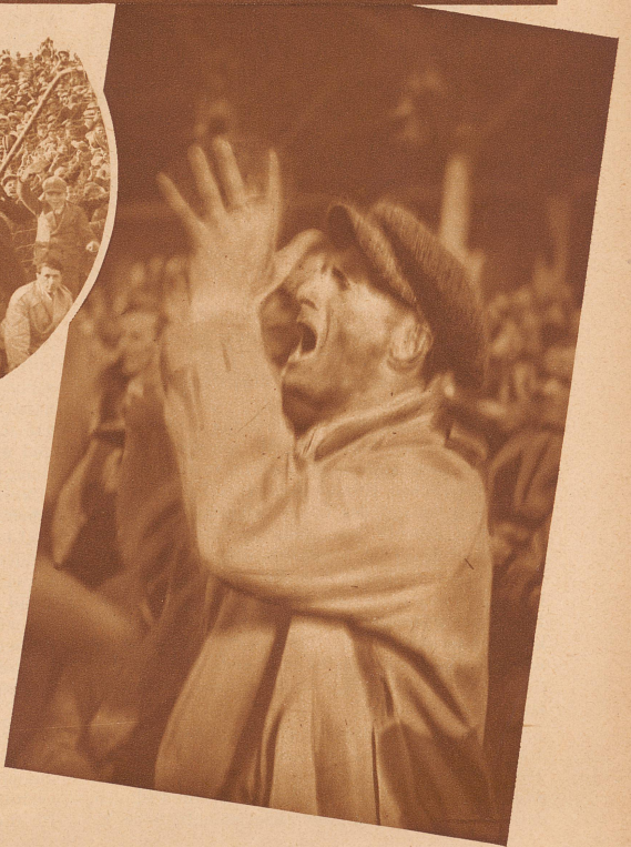
Bild rechts: Italia!! Italia!! Kurz vor Spielschluß kam der Ausgleich: Tor für Italien