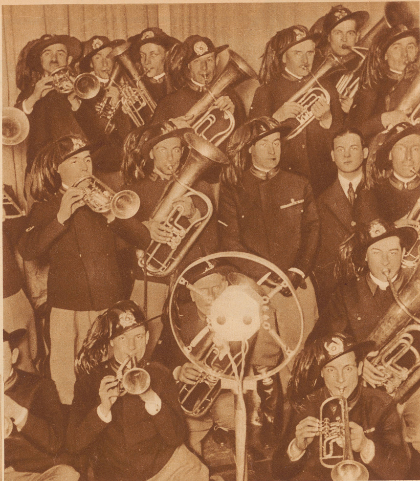
Bersaglieri-Kapellen spielen schneidige Märsche vor dem Mikrophon in Mailand

Man macht sich hierzulande meist falsche Vorstellungen vom italienischen Rundfunk. Die hervorragende Qualität der Sender, die gerade in der Schweiz ausgezeichnet empfangen werden können, läßt bei vielen die Meinung aufkommen, als marschiere der italienische Rundfunk in der ersten Reihe der Radiostaaen. Das ist nun doch nicht der Fall. Das Interesse der italienischen Bevölkerung für Radio ist noch sehr gering. Während man in der Schweiz Ende 1929 bereits 83 000 Konzessionäre zählte, bei 3,8 Millionen Einwohner, waren es in Italien nur 85 000 Konzessionäre bei 41 Millionen Einwohner. Zahlenmäßig steht Italien fast an letzter Stelle. Der italienische Rundfunk hat nur vier Programmformen, die ihm von Bedeutung schei-