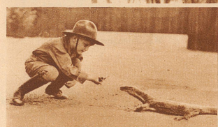
Das Guana, das so wenig scheu war, daß es sich aus Neugier für die Tabakspitze vom Söhnlein des Forschers ruhig fangen ließ