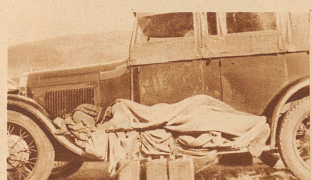
Hotels gibt es nicht im Innern Australiens. Aber ein Forscher muß sich in allen Lagen zu helfen wissen: Er schläft auf dem Trittbrett des Autos