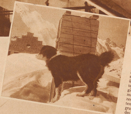
Ringgis Morgen-spaziergang geht über die verschneiten Dächer des Logierhauses. Das Kamin hat einen schützenden Hut erhalten. - Im Hintergrund der Giebel des neuen Hospiz