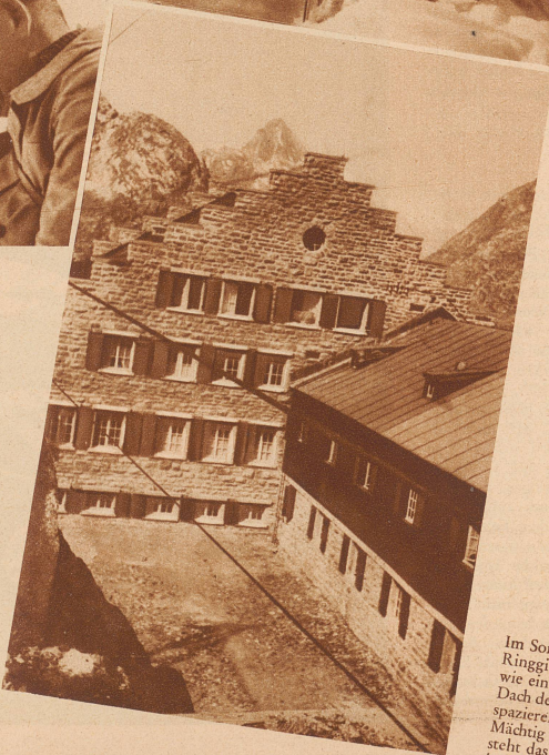
Im Sommer dürfte es Ringgi schwerfallen, wie ein Kater auf dem Dach des Logierhauses spazieren zu gehen. Mächtig und sicher steht das neue Hospiz in der Sommersonne da