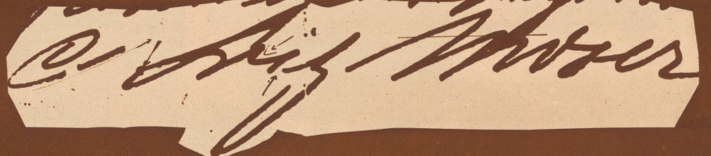
Die angeblich gefälschte Unterschrift Mosers weicht in verschiedener Hinsicht von der echten ab: der Schlußzug des «C» ist stark nach oben gezogen, der i-Punkt sofort nach Vollendung des i-Grundstriches gesetzt und der erste Grundstrich des «M» wesentlich höher als bei der echten Unterschrift