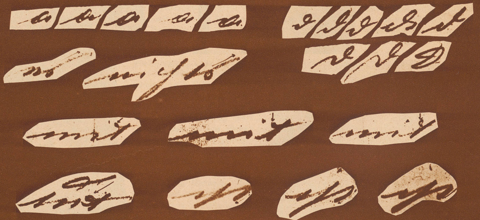
Die Betrachtung der einzelnen Buchstaben zeigt auffallende Brandbriefe mit einem Anstrich, wie er in Mosers Schrift nie