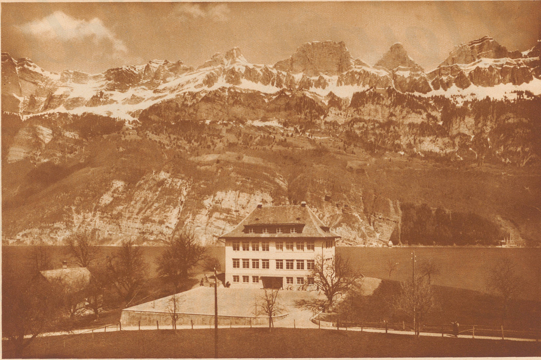
Wer möchte da nicht noch einmal Schüler werden? Das neue Schulhaus in Mols am Walensee. Anschauungsmaterial für den Unterricht in Geographic und Geologie liegt vor den Fenstern