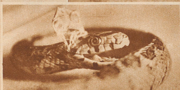
Wieviel Schlangen? Gar kein Kopf? O, doch! Mindestens sechs Köpfe sind sichtbar. Vier Arten lassen sich feststellen: 1. die intensiv gefleckte Leopardnatter, 2. die Vipernatter mit dem Zickzackband auf dem Rücken, 3. die ungemusterte große Acculapschlange; 4. Tropidonatus Tasciatus var. Lipedon mit weißen Querbändern