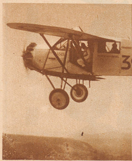
Bild links: Wir sehen hier Böhlen in der Türöffnung seines Flugzeugs sitzend, unmittelbar vor dem Sprung in die Tiefe

Unser Photograph verfolgte ihn in einem Begleitflugzeug, das die Aviatik beider Basel uns freundlicherweise zur Verfügung stellte