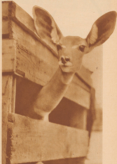
«Antilopenaugen sehen dich an!» — und man freut sich, wenn man den Blick dieser großen, sanften, spiegelnden Augen auf sich gerichtet fühlt. Stadt und Zoo sind um einen lieben, sympathischen Einwohner reicher

Mit großen, sanften Augen haben Zebra, Antilope und Giraffe den Transport aus einer fremden, heißen Welt in zürcherische Gefilde über sich ergehen lassen. Von neugierigen schwarzen Gesichtern begleitet, haben sie Addis Abeba verlassen; von neugierigen weißen Gesichtern eskortiert, haben sie in Zürich ihren Einzug gehalten. Nun wird das kaiserliche Geschenk hoffentlich lange Jahre jungen und alten Republikanern Freude machen!