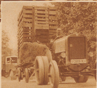
Knapp vor dem Ziel: Die kostbare Ladung wird den Zürichberg hinauf und in den Zoo eingefahren. Es rüttelt und schwankt, — aber dagegen sind alle diese Tiere nun schon gründlich abgestumpft