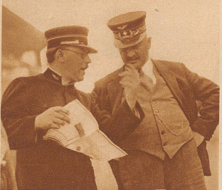
Ein nicht alltägliches Ereignis auf den S. B. B.; wie oft kommt es vor, daß man einen Frachtbrief in Händen hält «ausgestellt für Spedition, Verzollung und Ablieferung einer Giraffe, einer Antilope, eines Zebras und diverser anderer Tiere?»

Der kaiserliche Spender: Ras Tafari, der sich seit seiner Krönung Haylé Selassi nennt, der Negus Negesti von Abessinien (zu deutsch: König der Könige), hat dem Zürcher Zoo drei wundervolle Tiere seines Landes geschenkt