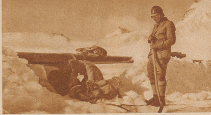
Um die Maschinen vor den heftigen Windstößen zu schützen, mußten sie während der Nacht hinter speziell aufgeworfenen Schneemauern fest verankert und am Morgen wieder ausgegraben werden