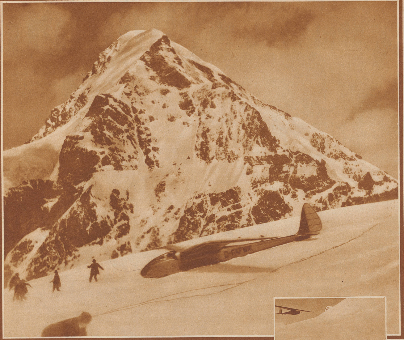
Segelflugzeug beim Start. Damit das Flugzeug starten kann, wird es von der Hilfsmannschaft an langen Tauen über das leichtgeneigte Schneefeld gezogen. Erst wenn es eine gewisse Geschwindigkeit erreicht hat, kann es sich erheben