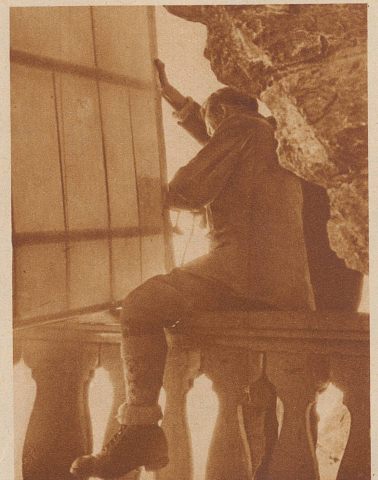
Die einzelnen Teile der demontierten Maschinen wurden von der Terrasse des Berghauses der senkrechten Felswand entlang zum Plateau emporgeseilt — bei dem schwierigen Weg und dem sehr empfindlichen Material eine äußerst kitzlige Manipulation