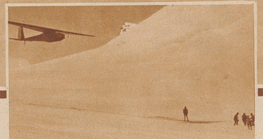
Oberleutnant Farner unmittelbar nach dem Start zu dem wohl-gelungenen Rekordflug von 1 1/2 Stunden Dauer