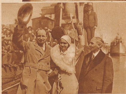
Von links nach rechts: Der Polarforscher Hubert Wilkins, Kommandant des «Nautilus», seine Gattin und der Enkel des Schriftstellers Jules Vernes, der die Expedition mitmachen wollte