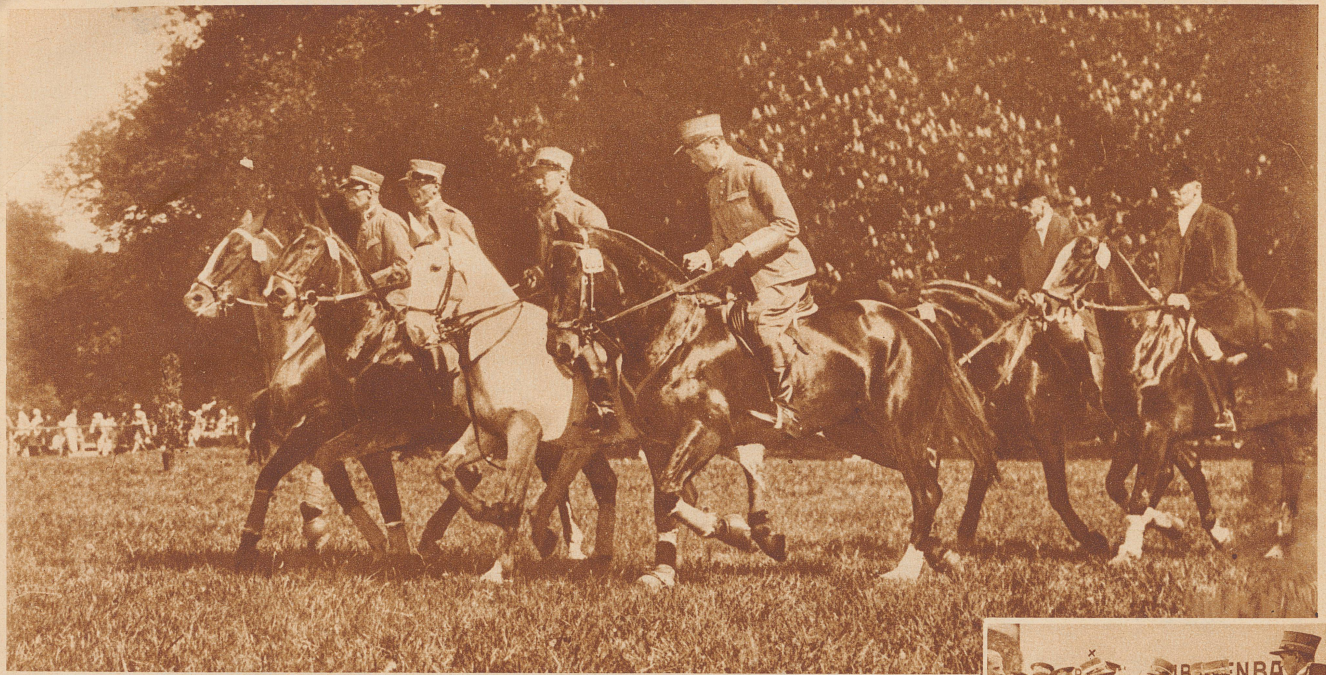
Internationales Reit- und Fahrturnier in Laxenburg bei Wien. Einreiten der Equipen. Die Schweizer