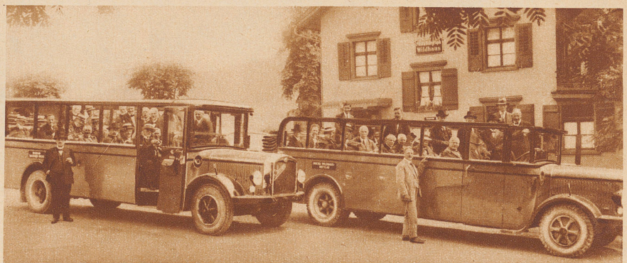
Zur Tagung des Schweizer. Evangelischen Kirchenbundes im Toggenburg Abreise der Versammlungsteilnehmer von Wildhaus, dem Geburtsort Ulrich Zwinglis