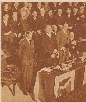
Zu Hause freute sich ganz England, daß er wieder da war. Es gab einen Vortrag vor der Handelskammer in Manchester. Die Engländer hörten aufmerksam zu. – 2700 Geschäftsleute schrieben sich hinter die Ohren, was dieser charmante Nichtfachmann ihnen zur Belebung ihres Handels anriet