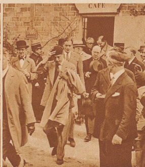
Auf der Rückreise hat der Prinz die Schiffs-gäste mit Kinoführungen von seiner eigenen Reise unterhalten. In Bordeaux ging man an Land, dann zum Flugplatz, dort gibt's eine kleine Kaffestube, drin nahm er einen «Schwarzen», setzte sich die Baskenmütze wieder auf und flog heim