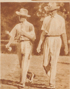
Eine kurze Unterbrechung der Reise und ein kleines Golfspiel in Jamaica. Der Heiß-Wetterdreß kommt zu seiner Geltung