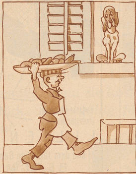
... sieht darum nicht, daß der «Caesar», der große Hund vom Tischler Langbein, mit gluckstigen Augen aus dem Fenster schaut: