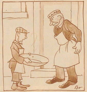
«Hier, Herr Wirt», sagt der Karli und holt die Schüssel vom Kopf herunter; und dann ... sagen beide zuerst gar nichts mehr. Nachher aber hat der Röbliwirt schon wieder den Mund aufgemacht, — fragt bloß den Karli, was er ihm alles erzählt hat!