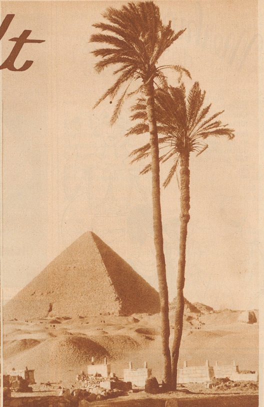
Die Pyramiden von Gizeh in Aegypten gehören zu den größten Pyramiden der Welt. Die größte ist 218 Meter hoch. Ihr könnt euch denken, daß Niki, dieser Träumer, einige Zeit gebraucht hätte, bis er wieder auf dem Boden angelangt wäre

Liebe Kinder! Der Niki weiß schon, was eine Pyramide ist. Der Lehrer hat ihm in der Geometriestunde eine große Pyramide aus Holz gezeigt, die war braungebeizt und spiegelglatt. Niki träumte sogar in der Nacht davon. Aber er träumte von einer richtigen Pyramide mitten in der Wüste. Diesen Traum muß ich euch erzählen, so merkwürdig ist er.