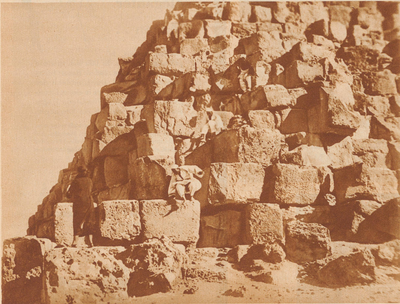
Eine Pyramide zu besteigen, ist gar nicht so einfach. Die Europäer, die hinaufklettern wollen, müssen ägyptische Touristenführer mitnehmen, die ihnen dann zeigen, wie man am leichtesten und raschesten hinaufkommt