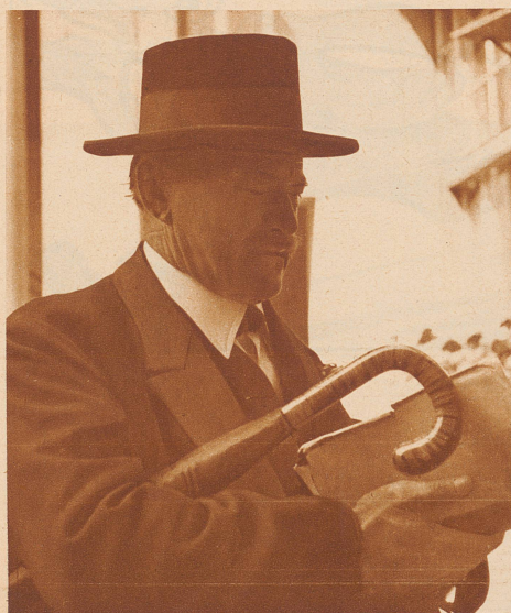
Er hat schon manchem Glarner Buben das ABC beigebracht