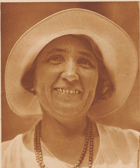
Primarlehrerin aus Zürich

Unserige zu der Sache mit Bildern bei. Seht sie an die Gesichter da aus dem Baselbiet, aus dem Bernbiet, aus dem Solothurnischen und der Ostschweiz usw. usw. Fragt nicht nach Namen, um Namen geht es nicht, es geht ums Wesen, soweit wir's im Gesichte lesen können. Wie findet ihr sie, diese Gesichter? Es geht nicht ab ohne einige verhärtete und starre oder kleinliche Züge, aber nicht wahr, da ist doch viel Freundlichkeit, Güte und Geduld zu sehen — und dann, wie ist's denn mit der Schule? — Ist es nicht so, daß wir in den Städten, wo wenig Raum zum Wohnen und wenig Raum zum Spielen und harmlos Leben ist, daß wir da alle, Väter und Mütter, froh sind, wenn wir zu Zeiten dem Lehrer die Buben und Mädchen in Obhut geben können. Nicht nur damit er sie lehre, nein, auch schon darum, daß er sie uns «abnehme». Und da sollten wir doch nicht vergessen, wieviel Kraft, Geduld und Hingabe, Ruhe und Umfänglichkeit des Gefühls es braucht und was für einen unerschöpflichen innern Jungbrunnen, um immer wieder dazwischen Kind mit Kindern sein zu können und nicht zum bloßen Einpauker zu erstarren. Wir sollen das Bild des Lehrers nicht nach jenen uns machen, die versagen, sondern nach jenen, die ihre Aufgabe lösen, und da kann doch das Ansehen nicht hoch genug sein, das ihnen gebührt, denn sie erfüllen eines der fruchtbarsten und wichtigsten Werke — sie lehren die Jugend —, sie arbeiten am Bilde des kommenden Menschen. K.