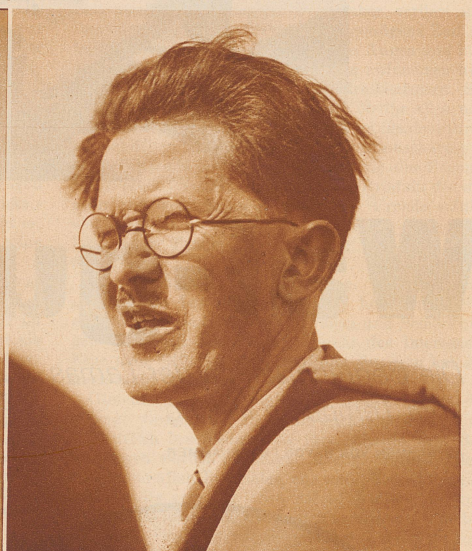
Junger Lehrer aus einem Luzerner Vorort