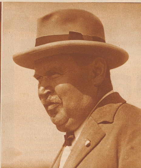
Primarlehrer aus dem Solothurnischen