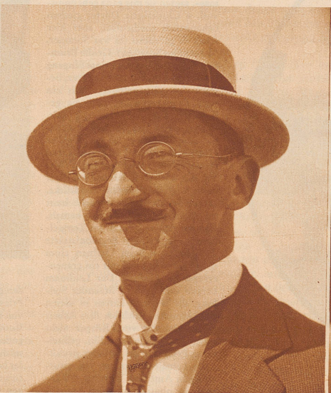
Seine Schule steht zwischen Murten und Freiburg