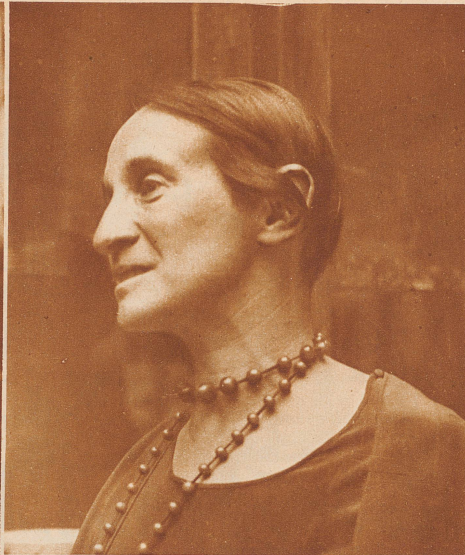
Dieses Fräulein unterrichtet baselstädtische Kinder