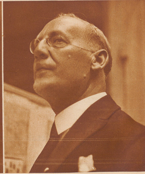
Zeichenlehrer aus Baselstadt