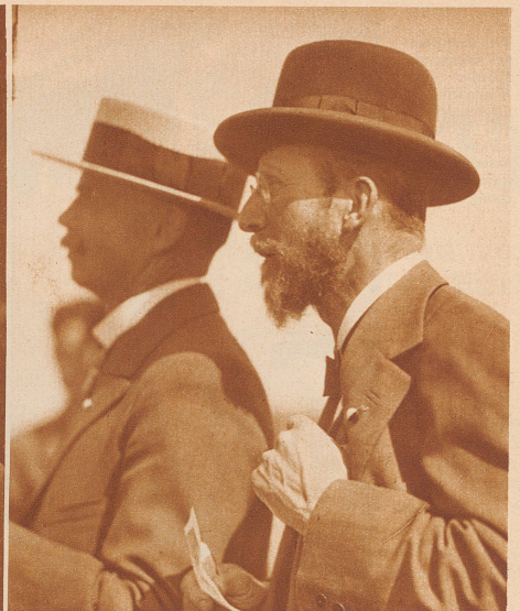
Zwei Profile aus Zürich