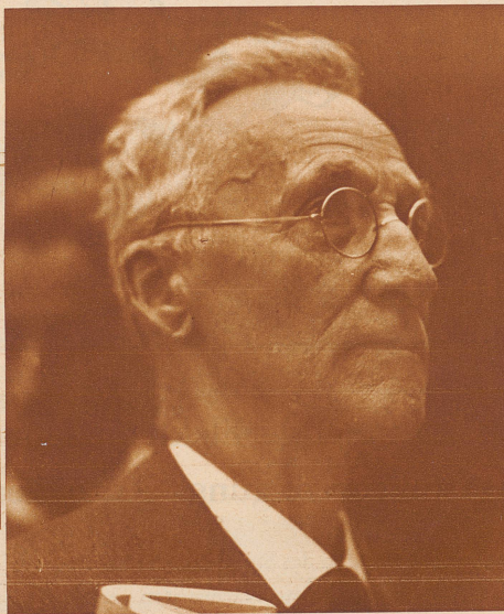
Dieses Gesicht fanden wir so sehr angenehm, daß wir's nicht weglassen wollten, auch wenn unsere Photographen nicht mehr wußten, wen sie da geknipst hatten