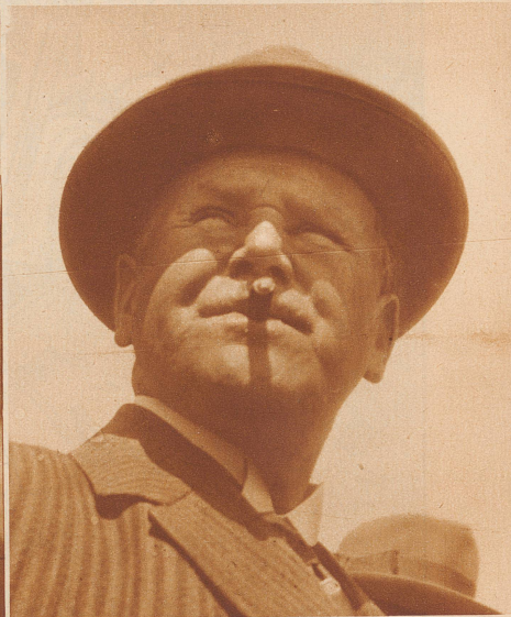
Aus dem Solothurnischen Wasseramt