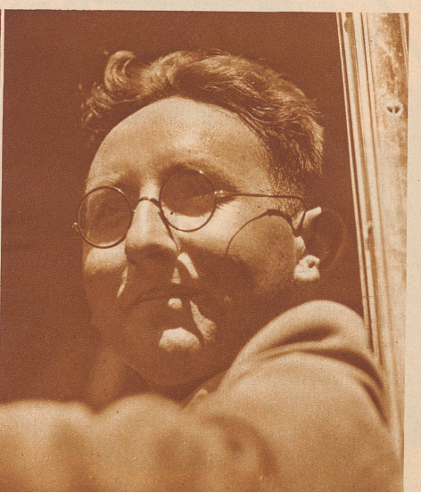
Seine Schule steht im Berner Mittelland