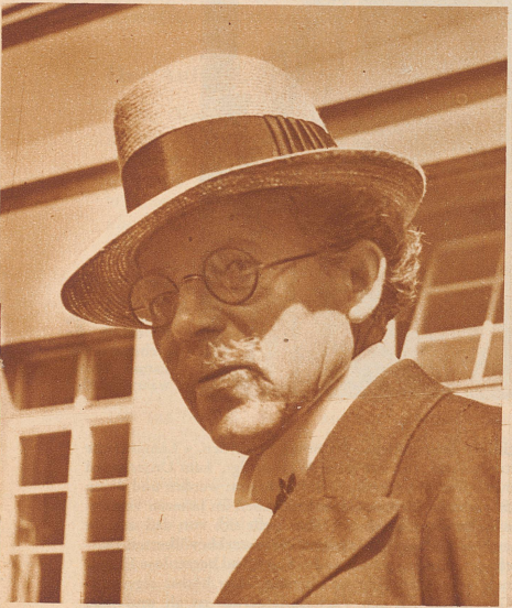
Sein Arbeitsfeld ist ein Bauerndorf im Basler Jura