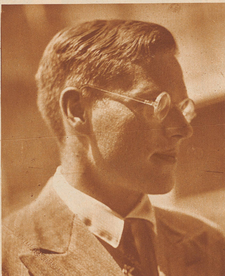
Er unterrichtet in Glarus