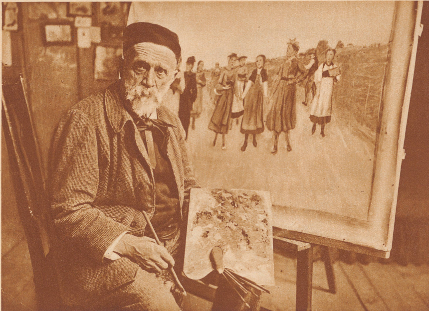
Der Maler Albert Anker , aufgenommen 1904 in seinem Heim in Ins.

Anlässlich des hundertsten Geburtsjahres Albert Ankers veranstaltet das Kunstmuseum Bern eine Gedächtnis-Ausstellung seiner Werke