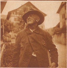
Im ganzen Kanton Bern und darüber hinaus hat der Riedel-Guala-Prozeß zu allerlei Erörterungen und Kommentaren Anlaß gegeben. Dieser Wegknecht, um seine Meinung befragt, antwortete ganz kurz: «i sägi nüt»!

niemals aufgehört, mächtig Staub aufzuwirbeln. Das Urteil lautete gegen beide Angeklagte auf 20 Jahre Zuchthaus. Zwanzig Jahre Zuchthaus, das bedeutet Vernichtung. Niemand haben die beiden Verurteilten aufgehört, ihre Unschuld zu beteuern, aber fünf Jahre hat es gedauert, bis die Gerichtsbehörden endlich dem Druck der öffentlichen Meinung nachgaben und dem Revisionsbegehren entsprachen. Die immerwährende Unschuldbeteuerung der Verurteilten war nicht Motiv genug zur Revision, jedoch: auch das Ergebnis der gerichtsmedizinischen Expertise von 1926 ist auf Grund neuerer Forschungen erheblich erschüttert. Die Voraussetzungen zur nochmaligen Ueberprüfung des Falles durch die übergeordnete Gerichtsinstanz sind mehrfach gegeben. Am 9. Juli hat das bernische Obergericht das Burgdorferurteil von 1926 kassiert und dem Revisionsbegehren entsprochen. Noch einmal haben die Geschworenen freie Bahn. Noch einmal soll die tragische, unheimliche Geschichte im Arzthaus von Langnau beurteilt werden. Alle die Tausende, die nie vollkommen von der Schuld der beiden Verurteilten überzeugt werden konnten, erleben die große Befriedigung, daß der ganze Fall noch einmal unter einer neuen, inzwischen eingeführten Strafprozeßordnung und von einem neugebildeten Geschworenengericht überprüft werden soll. Dieser neue Prozeß findet vermutlich im Spätherbst statt.