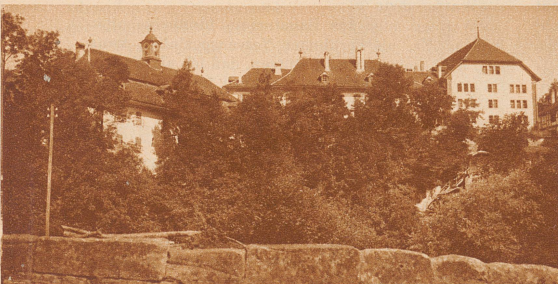
Einst: Schöner, bernischer Herrenlandsiß. Jetzt: Kantonale Strafanstalt.