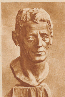
Loosli-Büste, modelliert von Pedro Meylan im Frühjahr 1915 in Morges