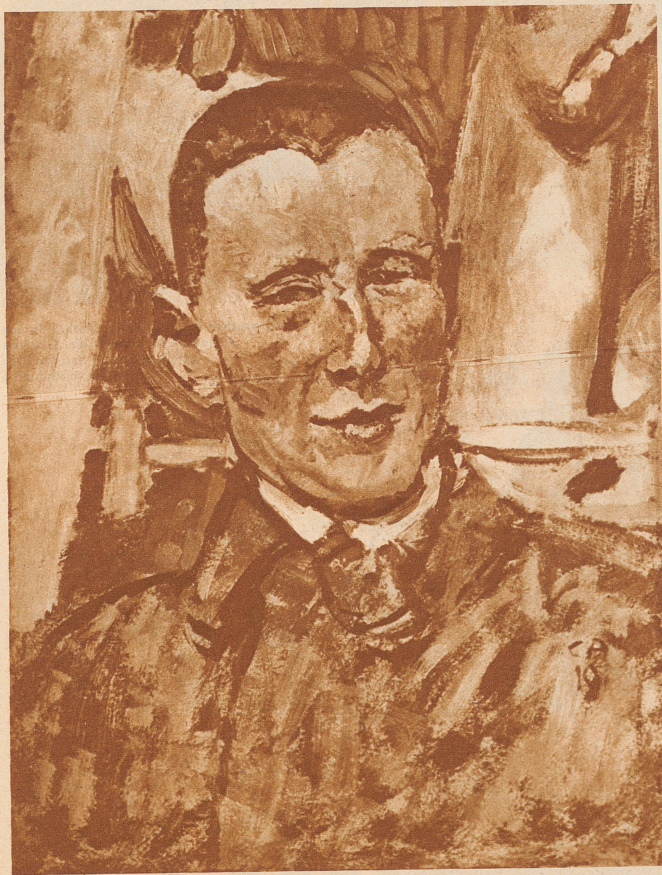
So malte ihn Dr. Cuno Amiet im Sommer 1919 auf der Ostwand. Das Bild gehört zu jenen Werken Amiets, die nicht ein Opfer der Flammen wurden