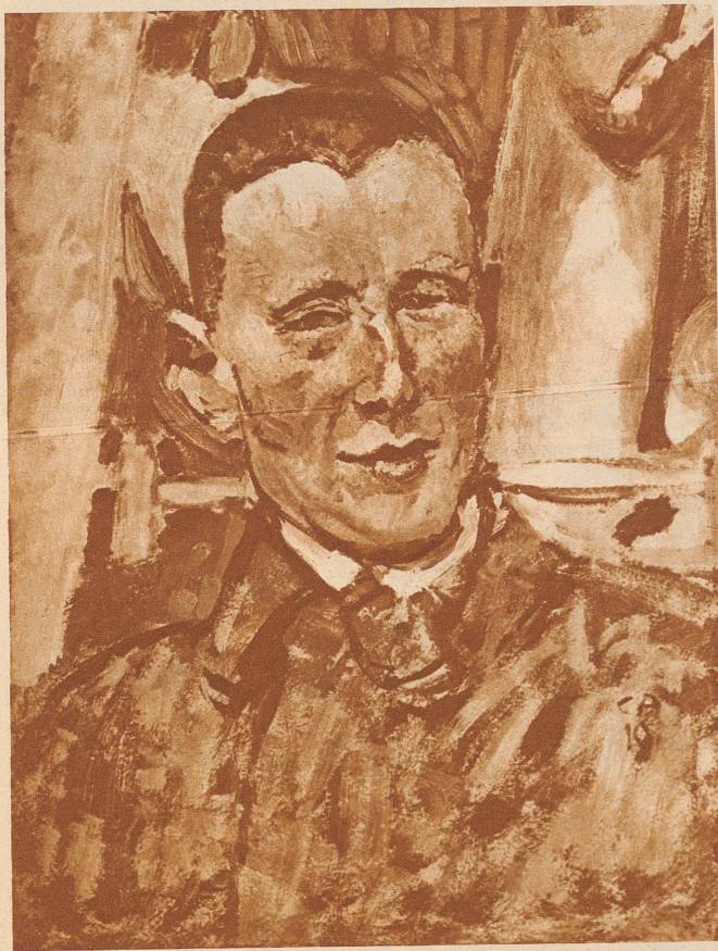
So malte ihn Dr. Cuno Amiet im Sommer 1919 auf der Ostwand. Das Bild gehört zu jenen Werken Amiets, die nicht ein Opfer der Flammen wurden