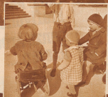
14 Uhr: Toffi, Toffi! ruft der Kleine auf seinen Kinderern. Er kann sich freuen, daß sein und breit kein größerer Schickel anstreifen ist