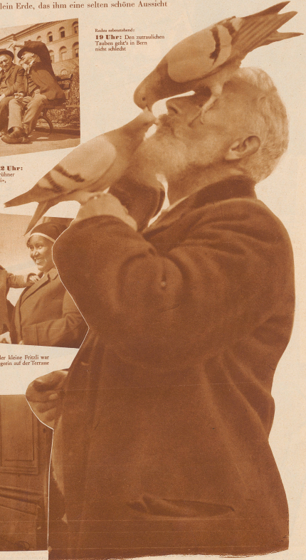
12 Uhr: Wende im Chiqui, früher ich alle viel höher ge, erinner ein Alter so- sen Freund