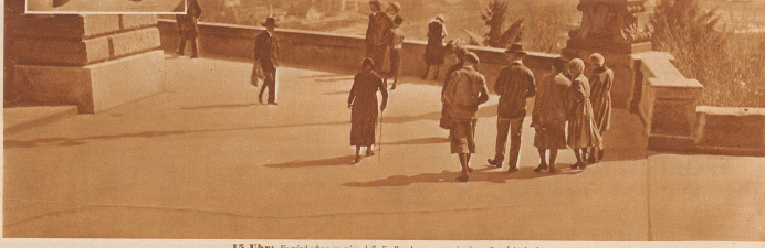
15 Uhr: Es wird schon so sein, daß die Bundesterrasse mit einem Verbleit in den verschieden Reichthumsbildern ausgezeichnet ist. Kein Fremder, der sie nicht aufsucht